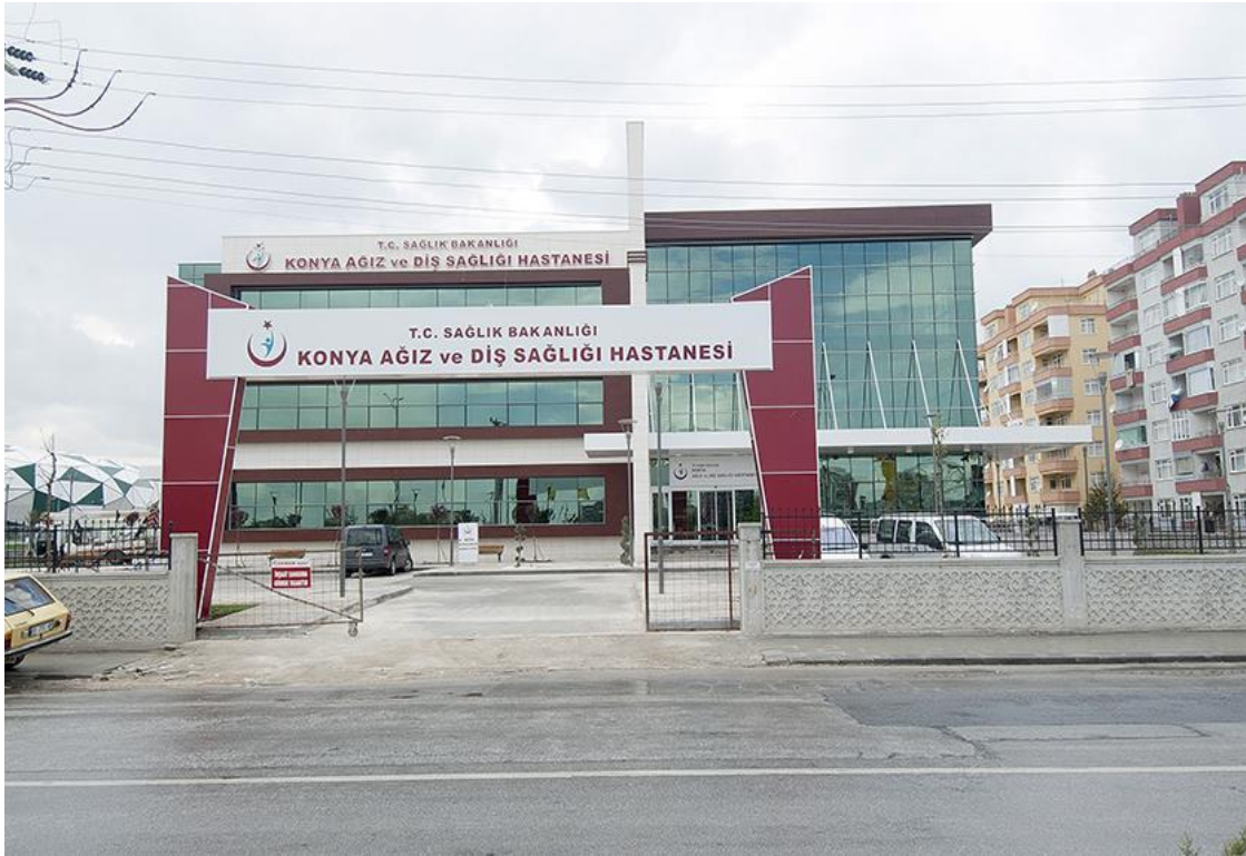
Fotoğraf 2: Konya Ağız ve Diş Sağlığı Hastanesi Dışarıdan Görünümü-2