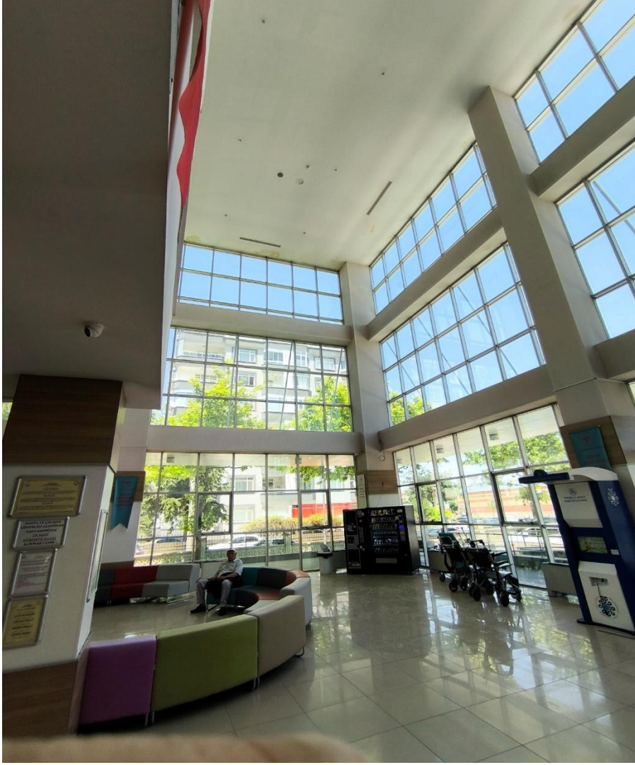
Fotoğraf 13: Konya Ağız ve Diş Sağlığı Hastanesi Girişi Bekleme Alanı ve Danışma