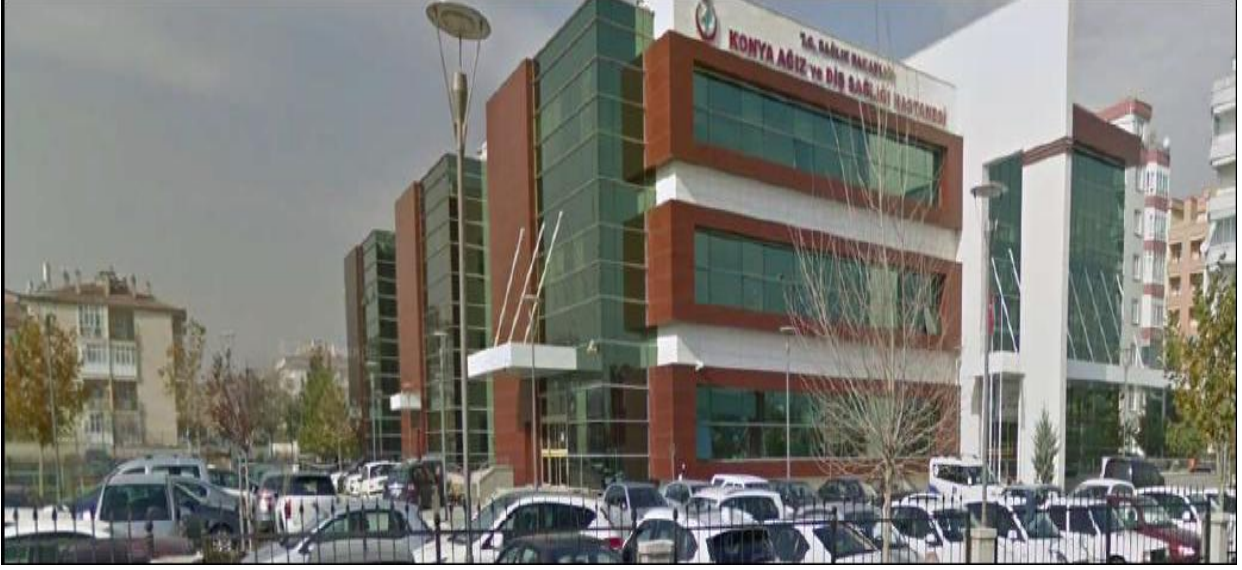
Fotoğraf 1: Konya Ağız ve Diş Sağlığı Hastanesi Dışarıdan Görünümü-1