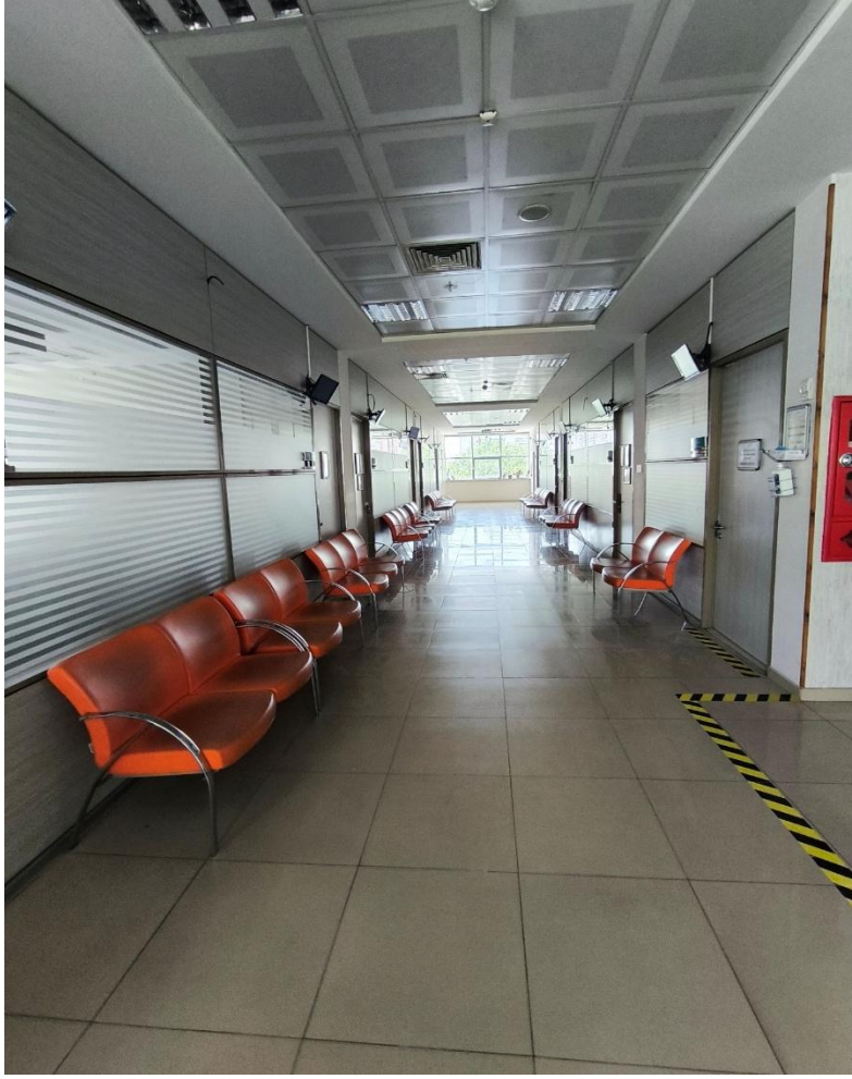
Fotoğraf 9: Konya Ağız ve Diş Sağlığı Hastanesi Muayene Odası Önü Bekleme Alanı