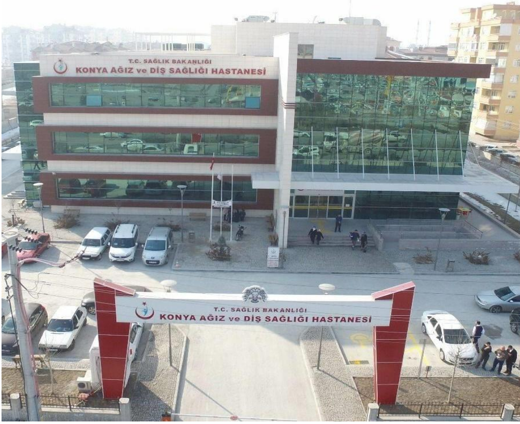
Fotoğraf 3: Konya Ağız ve Diş Sağlığı Hastanesi Dışarıdan Görünümü-3