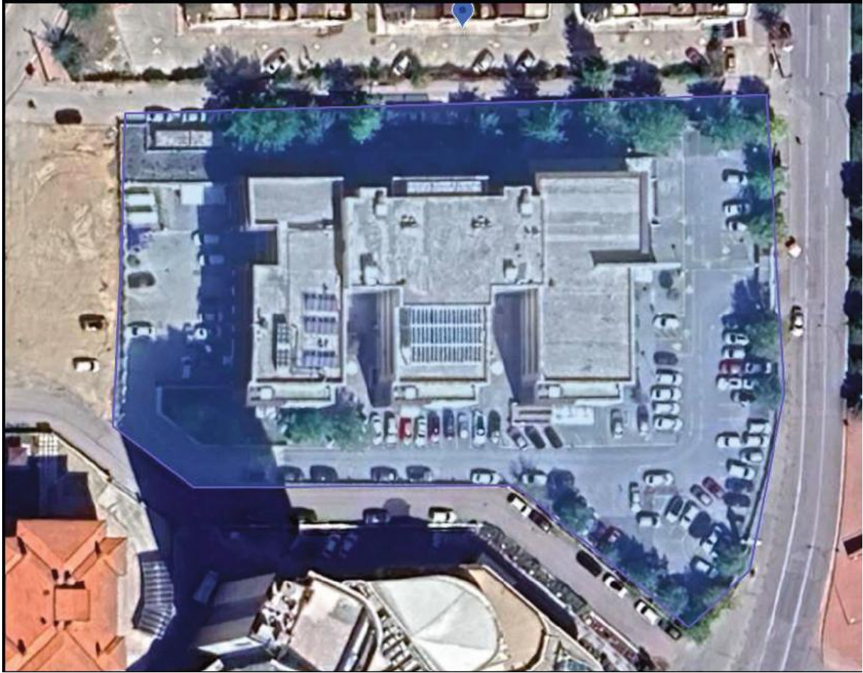
Şekil 1: Konya Ağız ve Diş Sağlığı Hastanesi Genel Görünümü

Konya Ağız ve Diş Sağlığı Hastanesi, Selçuklu ilçesi sınırları içerisinde yer almakta olup şehir merkezine kolay ulaşılabilir bir konumdadır. Hastane, Konya'nın en büyük sağlık yatırımlarından biri olarak modern diş sağlığı hizmetleri sunmaktadır. Bölgenin ulaşım olanakları gelişmiş olup, hastaneye şehir içi toplu taşıma araçları ve özel servislerle erişim sağlanabilmektedir. Çevresi yoğun yerleşim ve sağlık tesisleri ile çevrili olup, proje sahasında hassas alıcı bulunmamaktadır. Alt projeye ait bina genel yerleşimine ait uydu görüntüsü Şekil 1'de verilmekte olup bina mevcut durum fotoğrafları eklerde sunulmuştur.