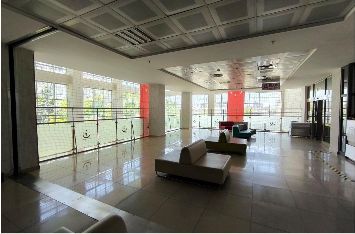
Fotoğraf 7: Konya Ağız ve Diş Sağlığı Hastanesi A Blok Bekleme Alanı