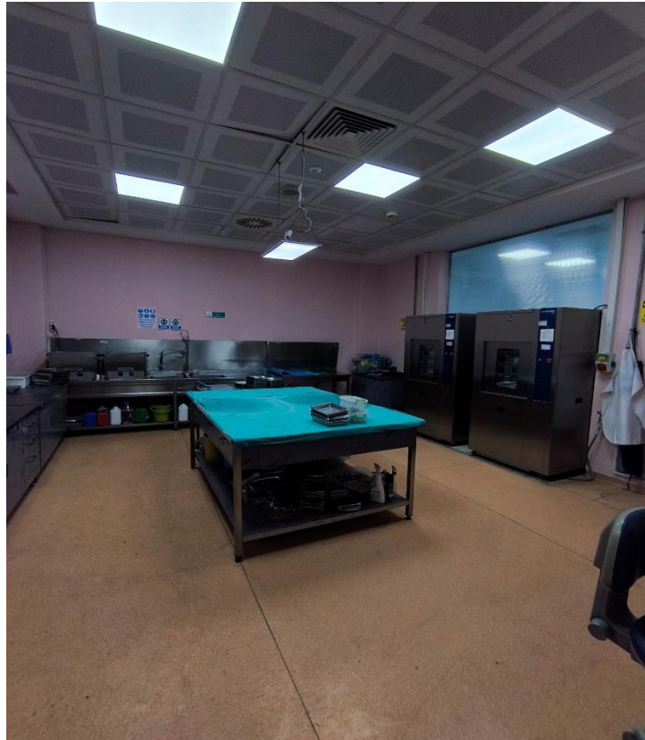
Fotoğraf 16: Konya Ağız ve Diş Sağlığı Hastanesi Sterilizasyon Odası