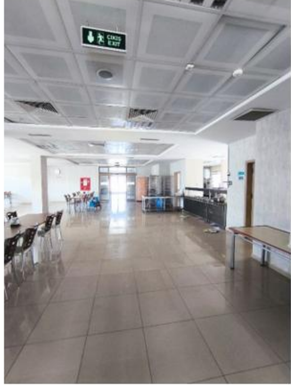
Fotoğraf 4: Konya Ağız ve Diş Sağlığı Hastanesi Tuvaletleri ve Yemekhanesi