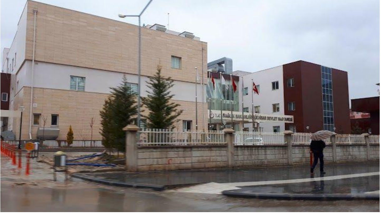
Şekil 2. Göhlisar Devlet Hastanesi Yerleşkesi Görünümü