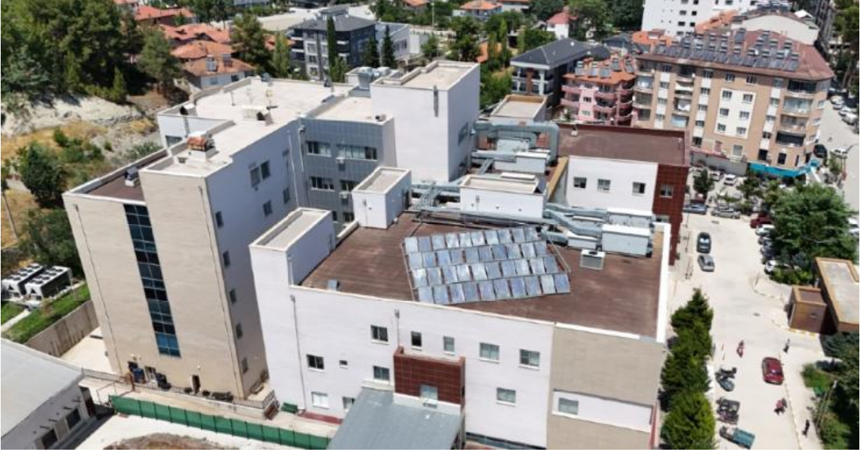
Şekil 6. Çatı Yapısı Genel Görşeli