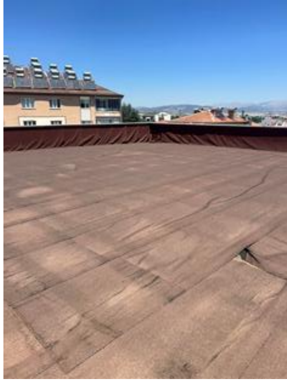
Şekil 5. Yerleşkeye ait Teras Çatı Örneği