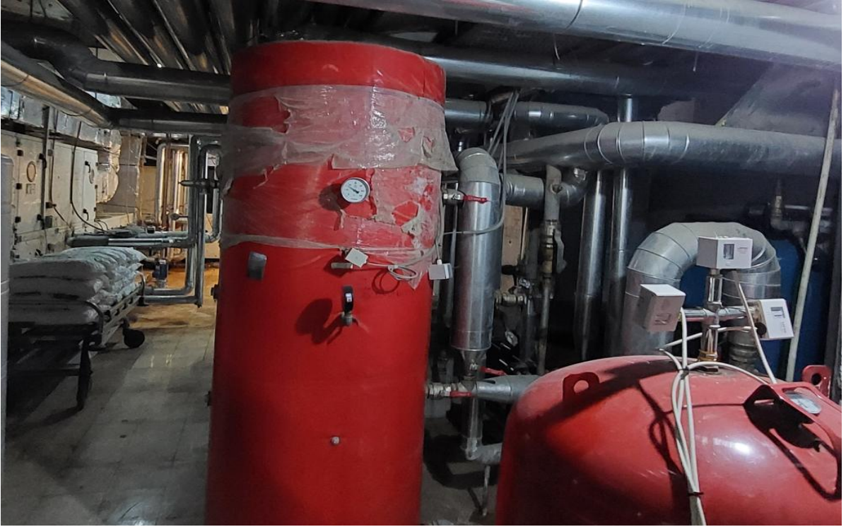
Şekil 9. Sıcak Kullanım Suyu Sistemi Görünümü