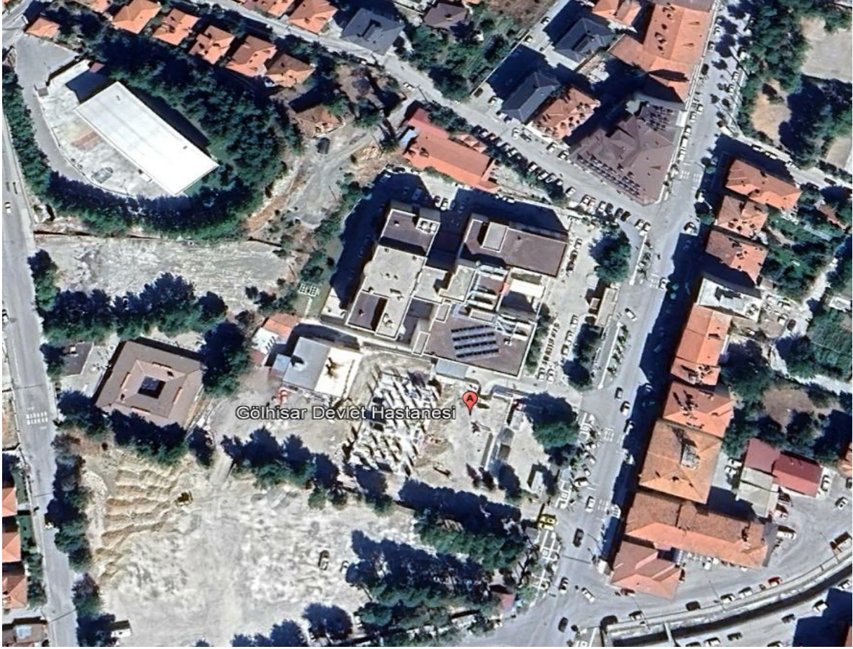
Şekil 1: Göhlisar Devlet Hastanesi’nin Uydu Görüntüsü

yakınlarında yaklaşık 200 m kuş uçuşu mesafesinde Göhlisar Gençlik Merkezi ve Göhlisar Halk Pazarı hassas alıcı ortamları bulunmaktadır. Alt projeye ait bina genel yerleşimine ait uydu görüntüsü Şekil 1’de verilmekte olup bina mevcut durum fotoğrafları Ek-1’de sunulmuştur.