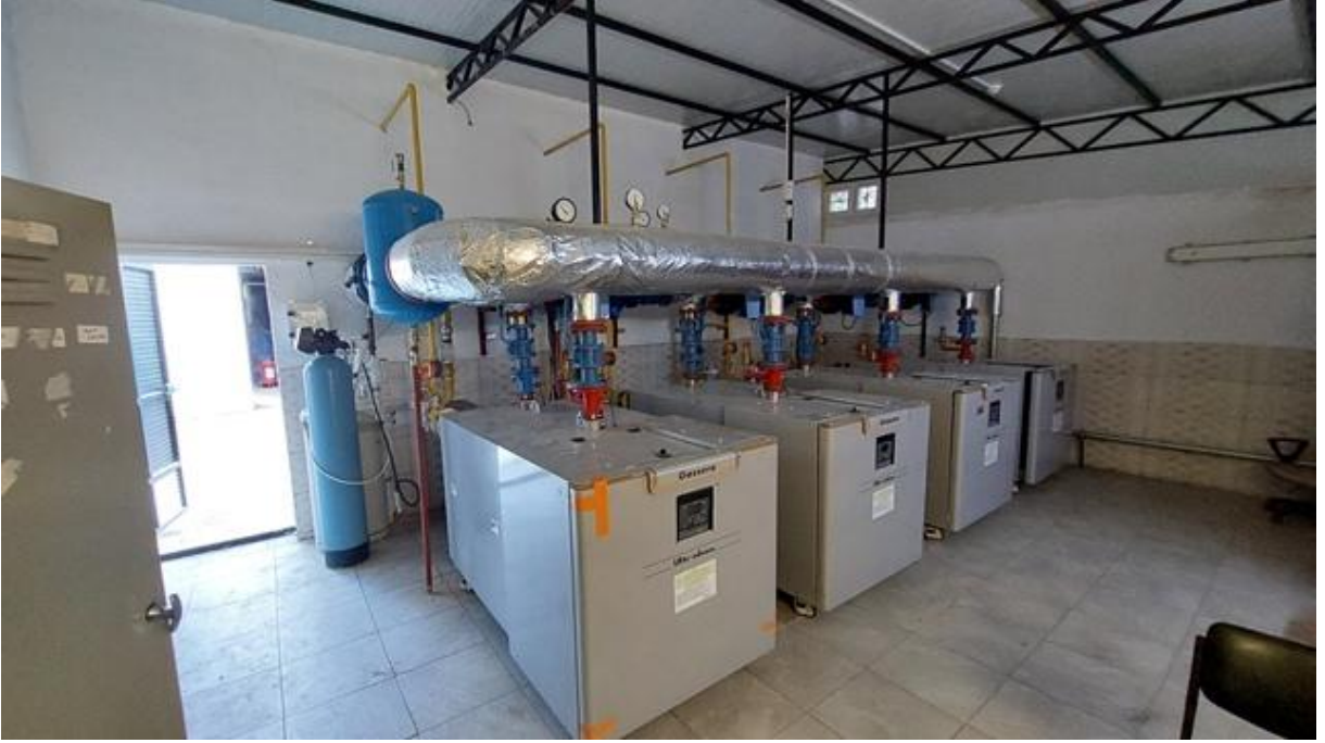
Şekil 7. Kazanların Görünümü