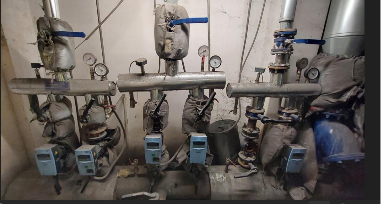
Şekil 8. Isıtma Sirkülasyon Pompalarının Görünümü