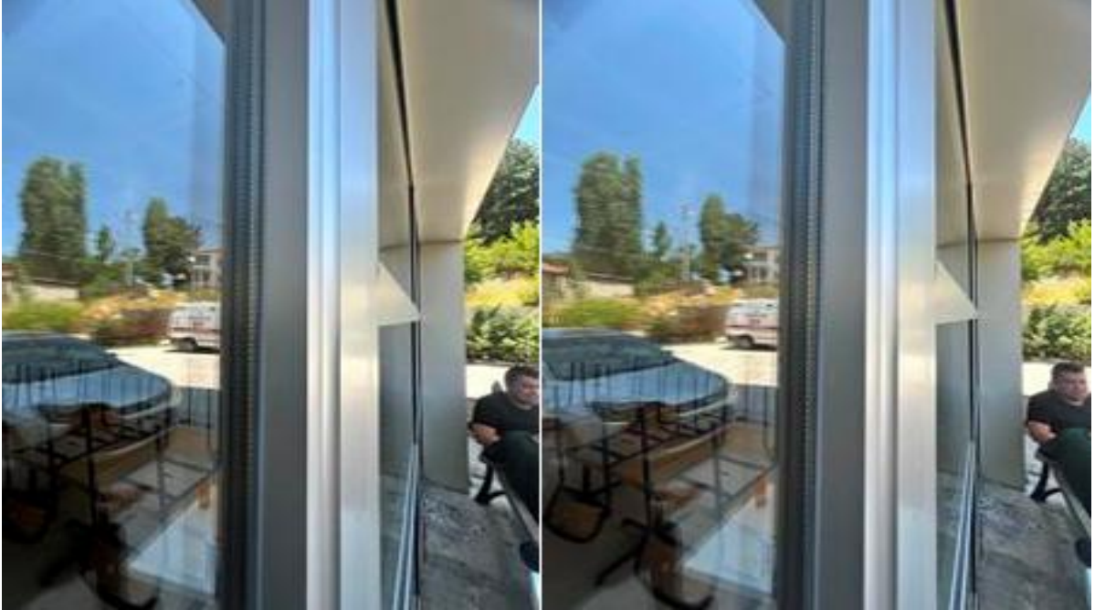
Şekil 3. Yerleşkeye Ait Pencere Doğraması Yapısı Örneği