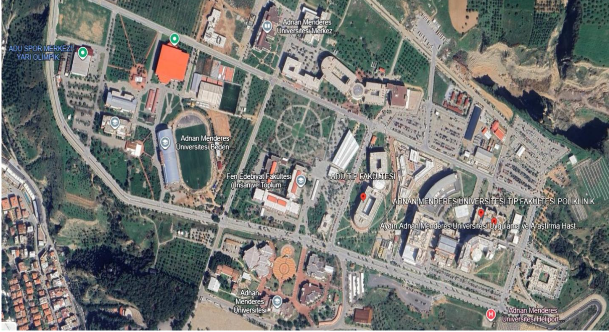
Şekil 1: Adnan Menderes Üniversitesi Ana Kampüs Proje Blokları Genel Yerleşim - Uydu Görüntüsü

Adnan Menderes Üniversitesi Ana Kampüs Proje Blokları, Efeler ilçesi sınırları içerisinde yer almakta olup şehir merkezine kolay ulaşılabilir bir konumdadır. Bölgenin ulaşım olanakları gelişmiş olup, kampüse şehir içi toplu taşıma araçları ve özel servislerle erişim sağlanabilmektedir. Çevresi ağırlıklı olarak konut yapıları ile çevrili olup, proje sahası yakın parsellerinde hassas alıcı ortam olarak park alanı mevcuttur. Alt projeye ait kampüs genel yerleşimine ait uydu görüntüsü Şekil 1’de verilmekte olup binaların mevcut durum fotoğrafları Ek-1’de sunulmuştur.