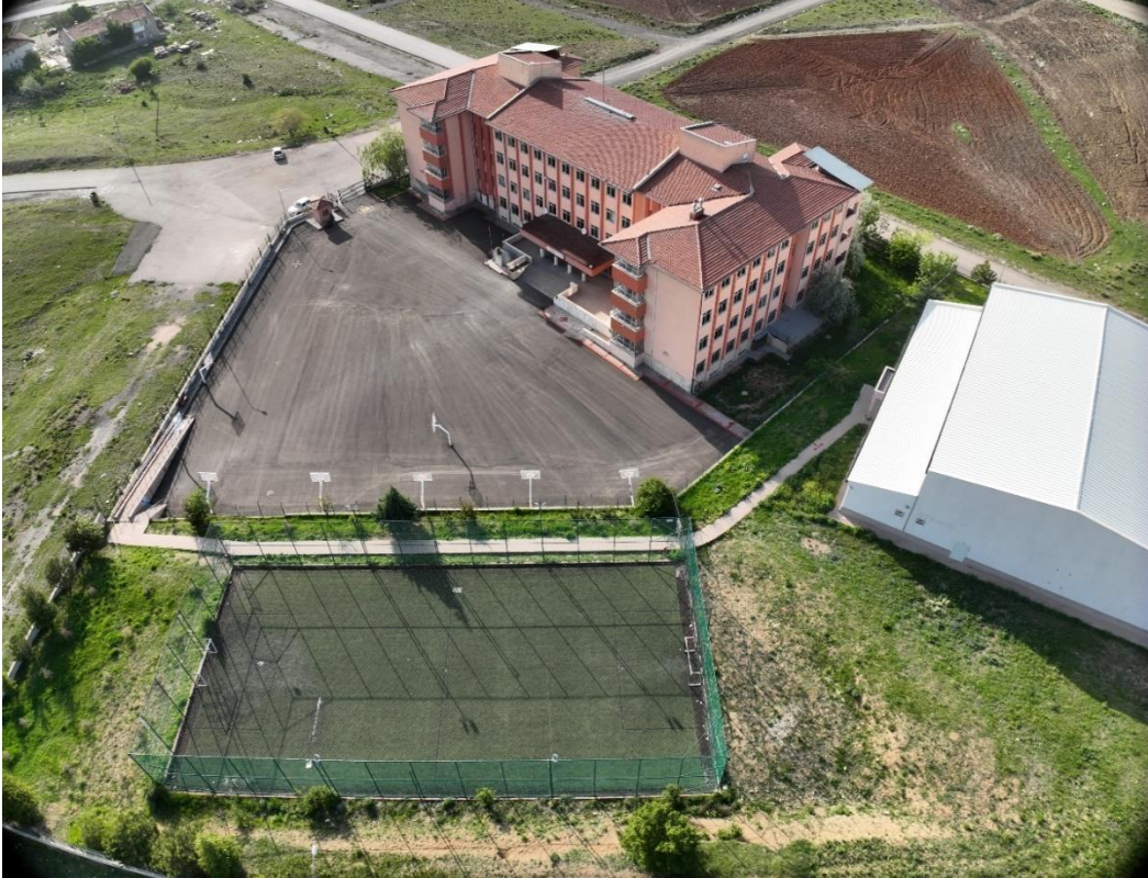
Şekil 4. Yakacık Şehit Tugay Can Kızılırmak Anadolu Lisesi Dron Görüntüsü