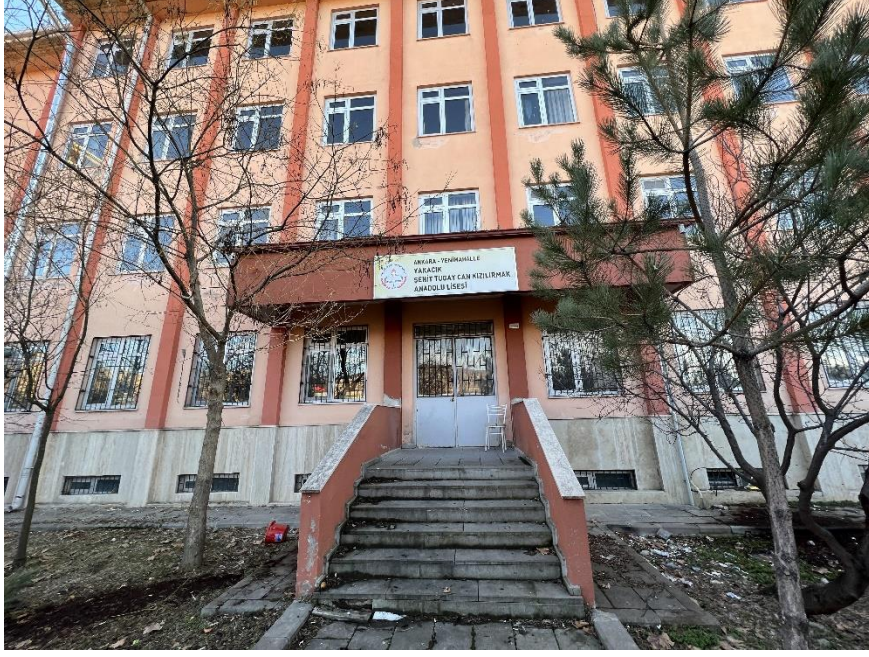
Fotoğraf 1. Yakacık Şehit Tugay Can Kızılırmak Anadolu Lisesi Dış Görünüş