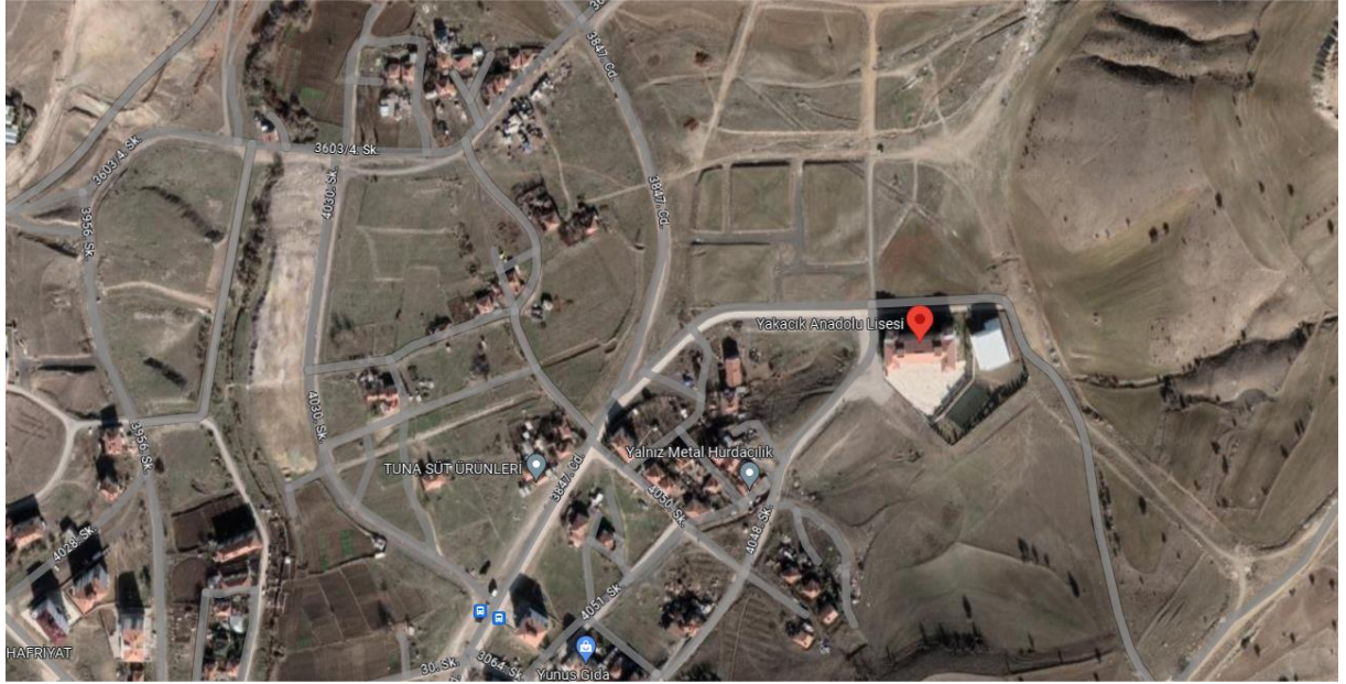
Şekil 2. Yakacak Şehit Tugay Can Kızılırmak Anadolu Lisesi Konumu