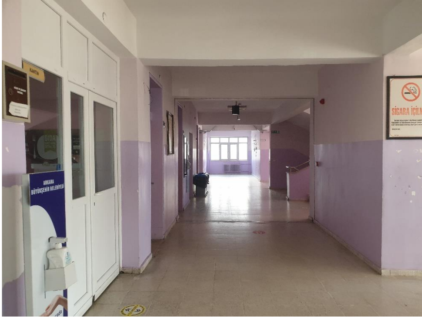
Fotoğraf 2. Yakacık Şehit Tugay Can Kızılırmak Anadolu Lisesi İçinden Bir Görüntü