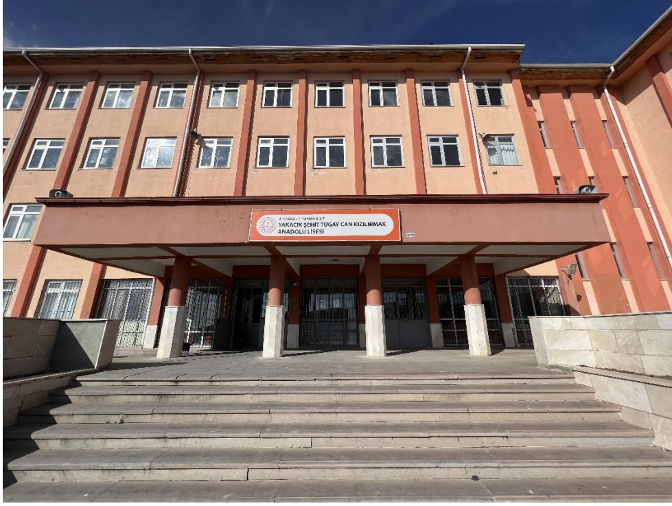
Şekil 3. Yakacık Şehit Tugay Can Kızılırmak Anadolu Lisesi Dış Görünüş