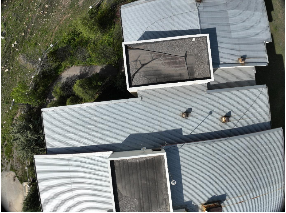
Şekil 5. Uluslararası Milli İrade Kız Anadolu İmam Hatip Lisesi Dron Görüntüsü-2