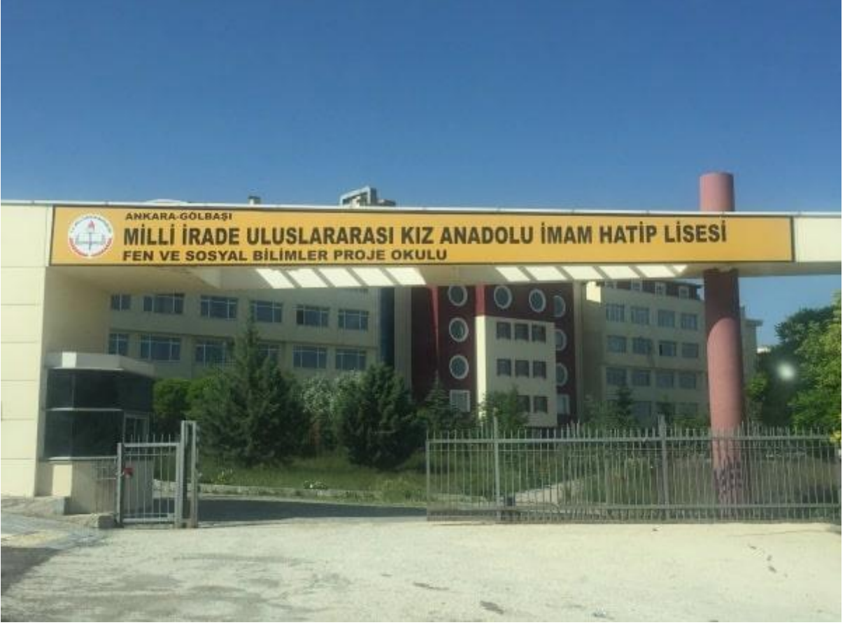
Fotoğraf 1. Uluslararası Milli İrade Kız Anadolu İmam Hatip Lisesi Dış Görünüş-1