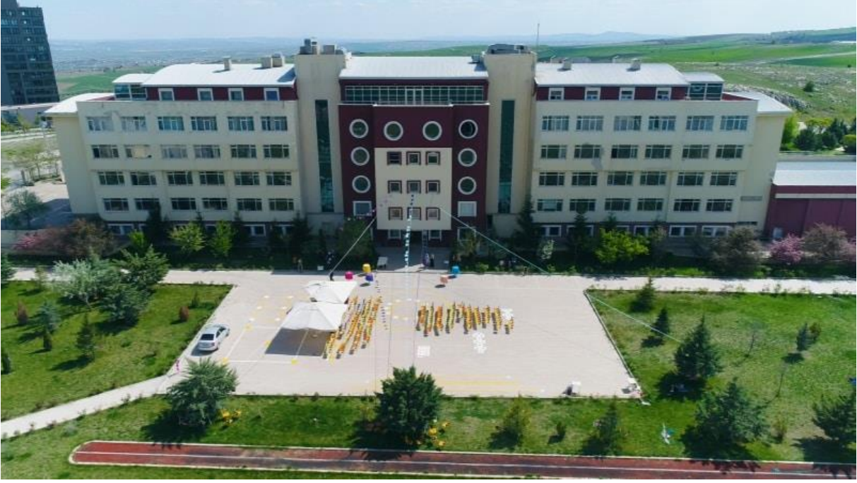
Şekil 3. Uluslararası Milli İrade Kız Anadolu İmam Hatip Lisesi Dış Görünüş