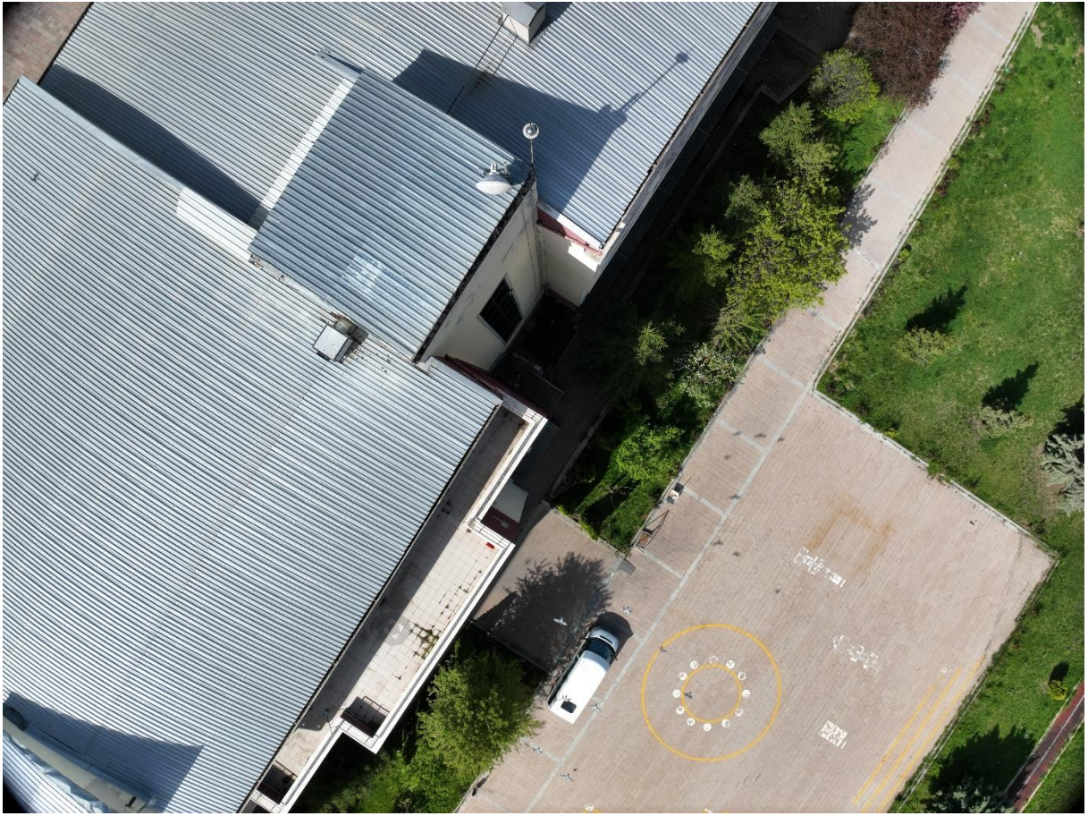
Şekil 4. Uluslararası Milli İrade Kız Anadolu İmam Hatip Lisesi Dron Görüntüsü-1