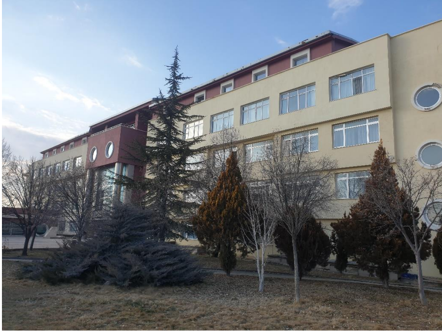
Fotoğraf 2. Uluslararası Milli İrade Kız Anadolu İmam Hatip Lisesi Dış Görünüş-2