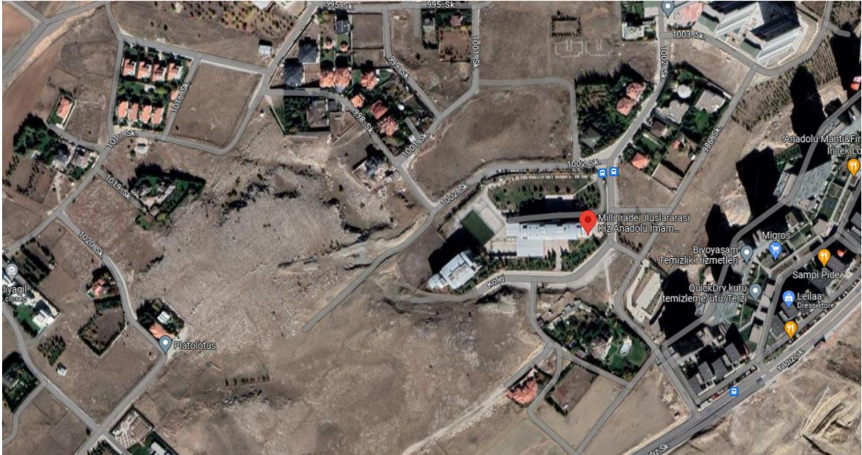
Şekil 2. Uluslararası Milli İrade Kız Anadolu İmam Hatip Lisesi Konumu