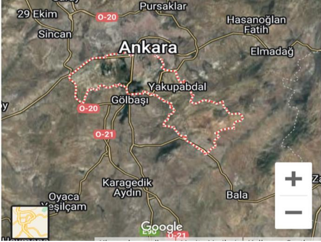
Şekil 4. Çankaya İlçesi Coğrafi Konumu