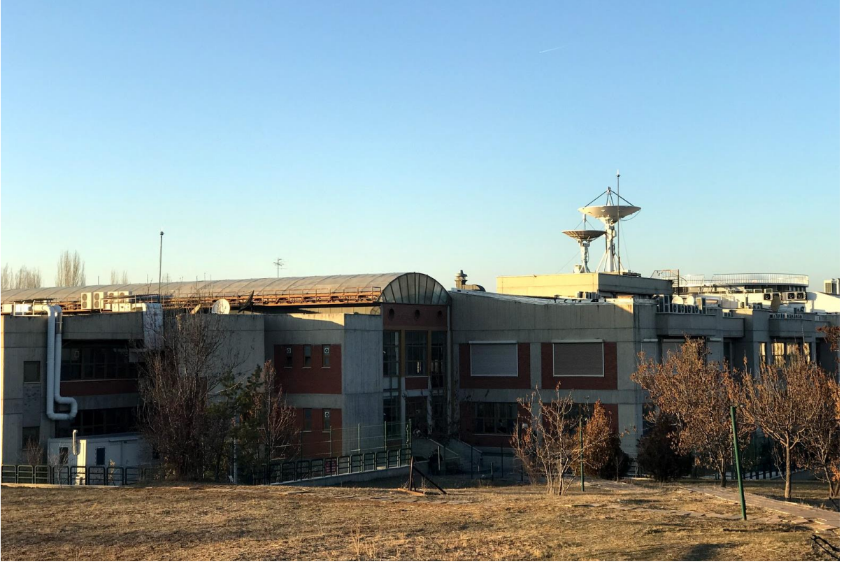
Şekil 3. TÜBİTAK Uzay Araştırmaları Enstitüsü Dış Görünüş-3