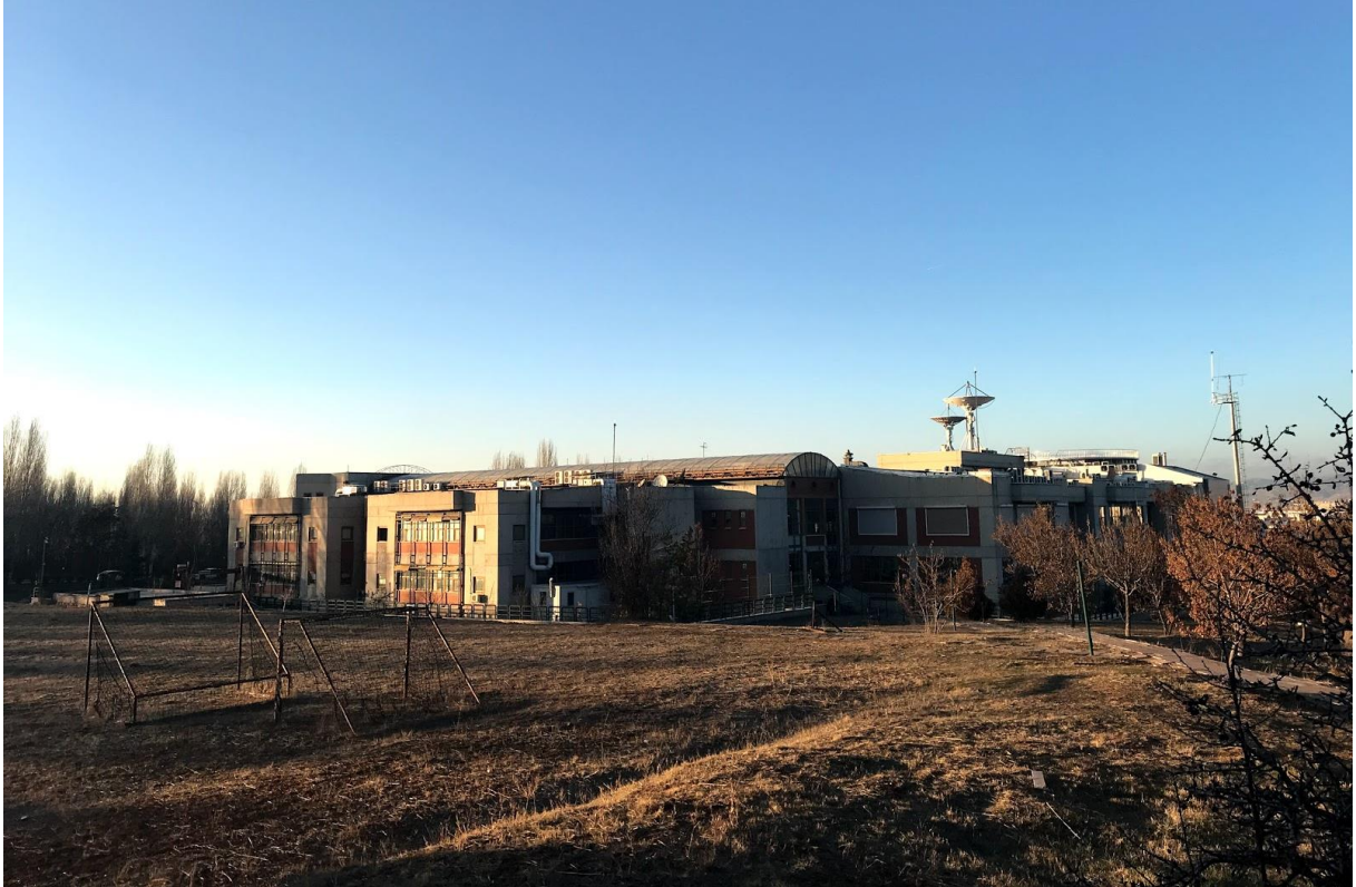
Şekil 2. TÜBİTAK Uzay Araştırmaları Enstitüsü Dış Görünüş-2