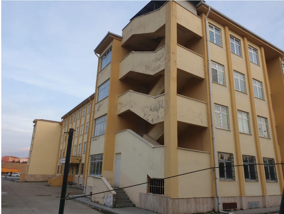
Şekil 4. Polatlı TOBB Fen Lisesi Dış Görünüş-2