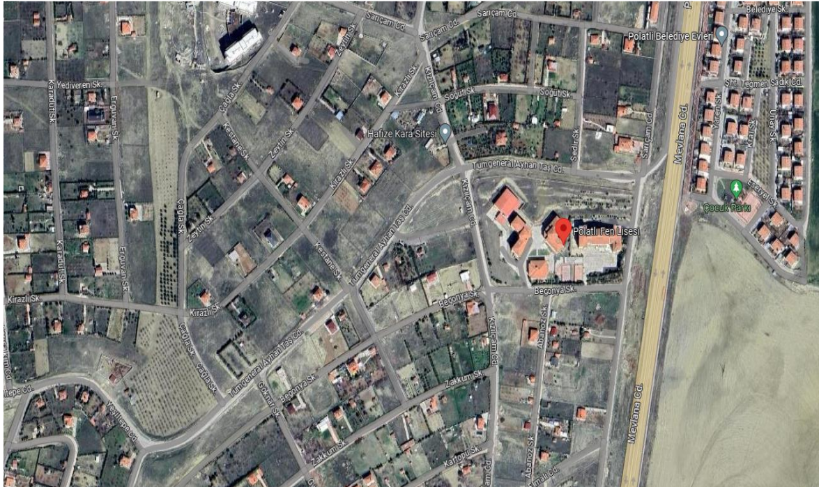
Şekil 2. Polatlı TOBB Fen Lisesi Konumu