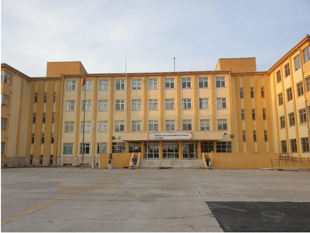
Şekil 3. Polatlı TOBB Fen Lisesi Dış Görünüş-1