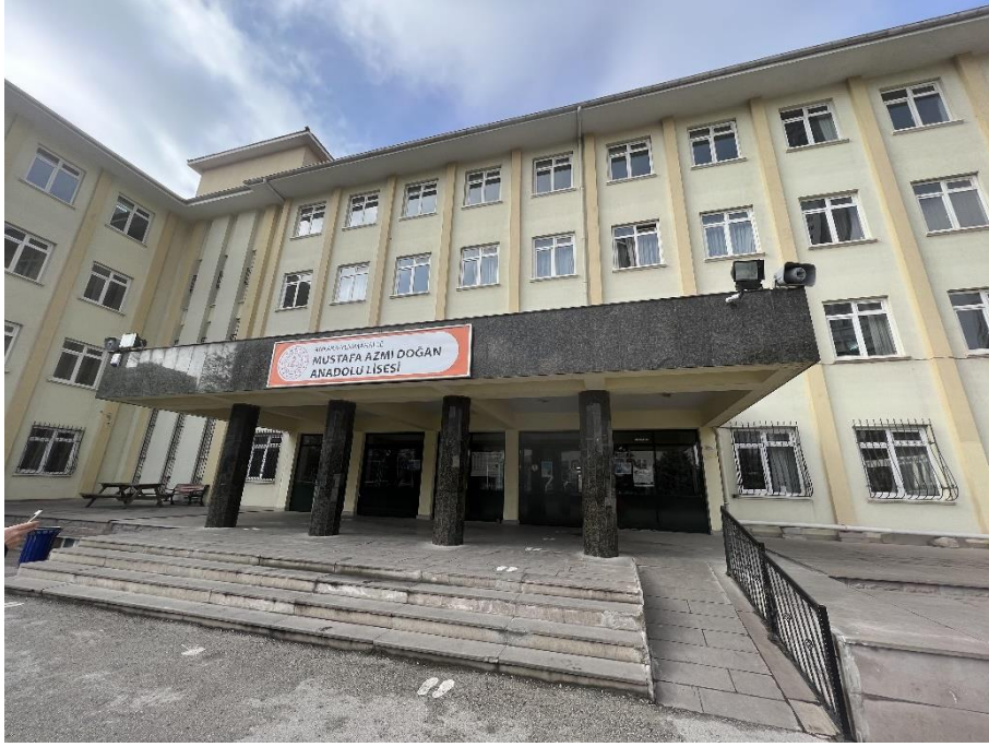
Şekil 3. Mustafa Azmi Mustafa Azmi Anadolu Lisesi Dış Görünüş-1