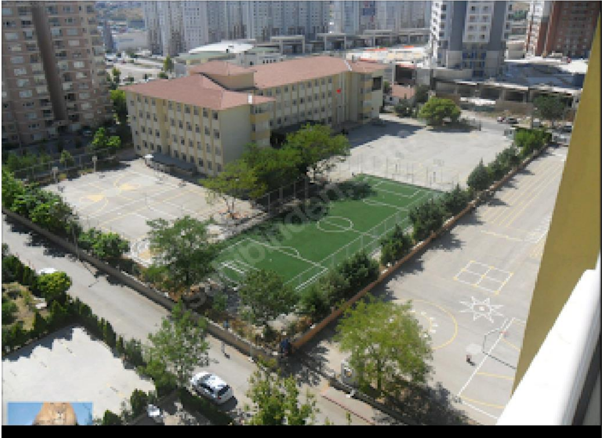
Şekil 4. Mustafa Azmi Mustafa Azmi Anadolu Lisesi Dış Görünüş-2