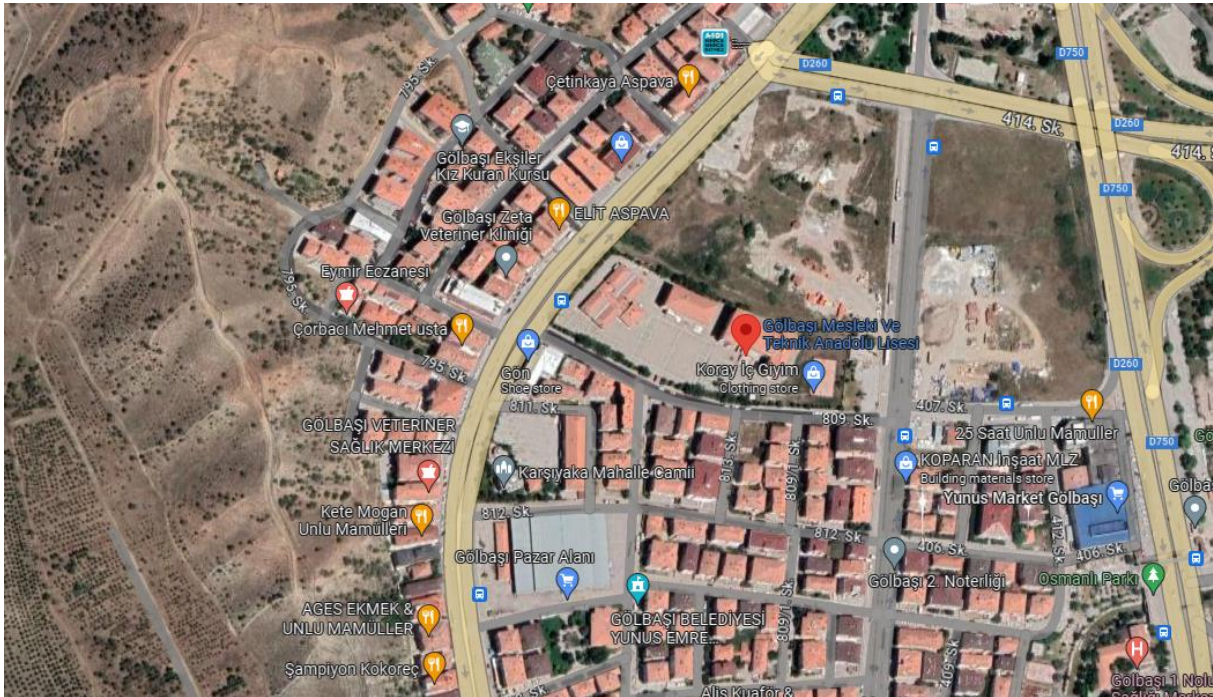
Şekil 2. Gölbaşı Mesleki ve Teknik Anadolu Lisesi Konumu