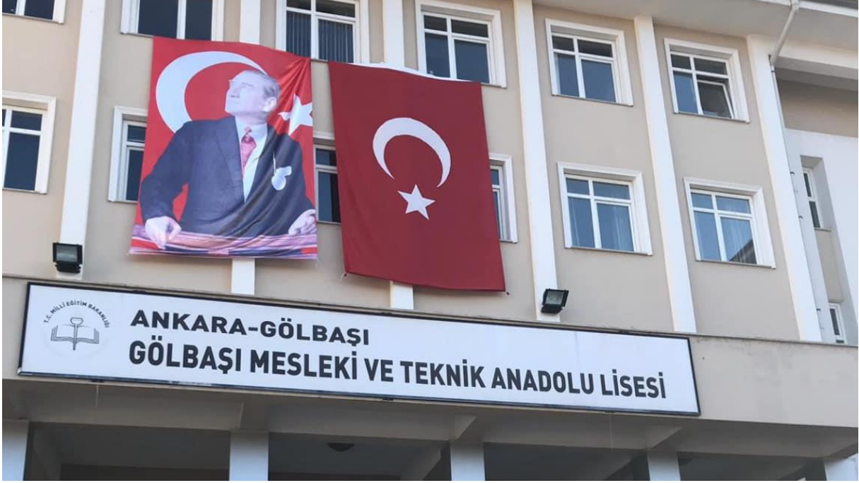
Şekil 3. Gölbaşı Mesleki ve Teknik Anadolu Lisesi