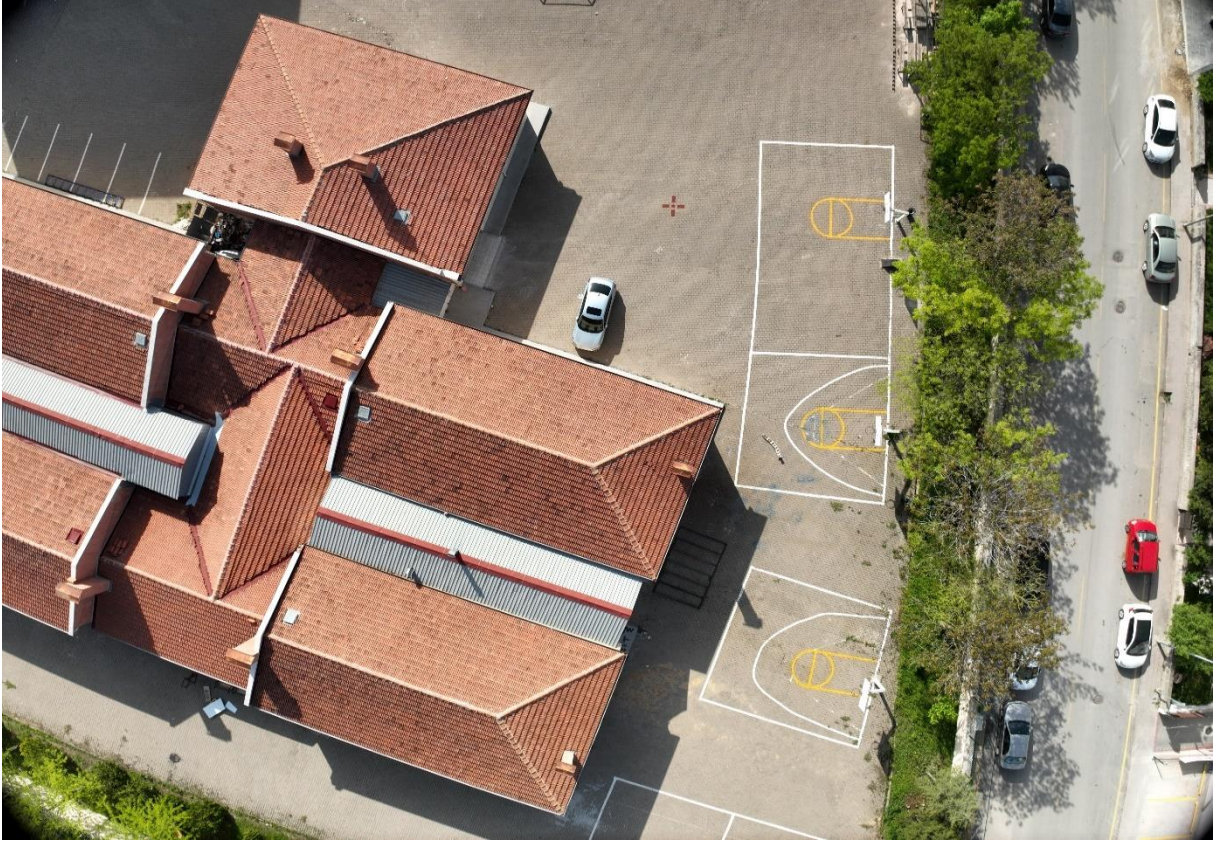
Şekil 4. Gölbaşı Mesleki ve Teknik Anadolu Lisesi Dron Görüntüsü-1