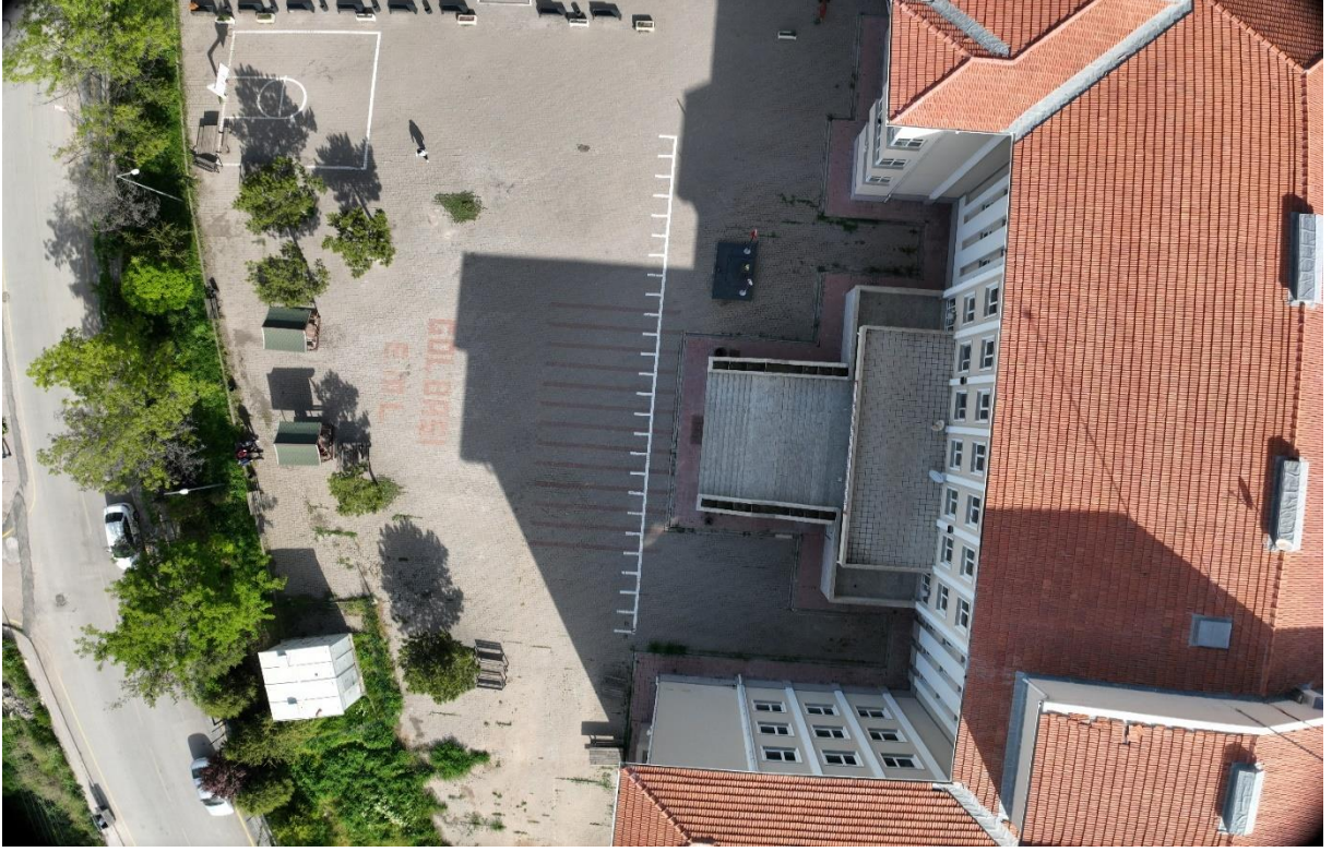
Şekil 5. Gölbaşı Mesleki ve Teknik Anadolu Lisesi Dron Görüntüsü-2