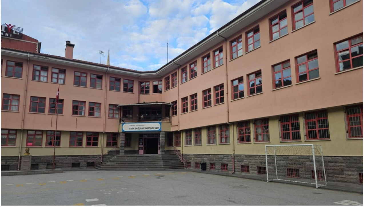
Şekil 3. Emin Sağlamer Ortaokulu Dış Görünüş-1