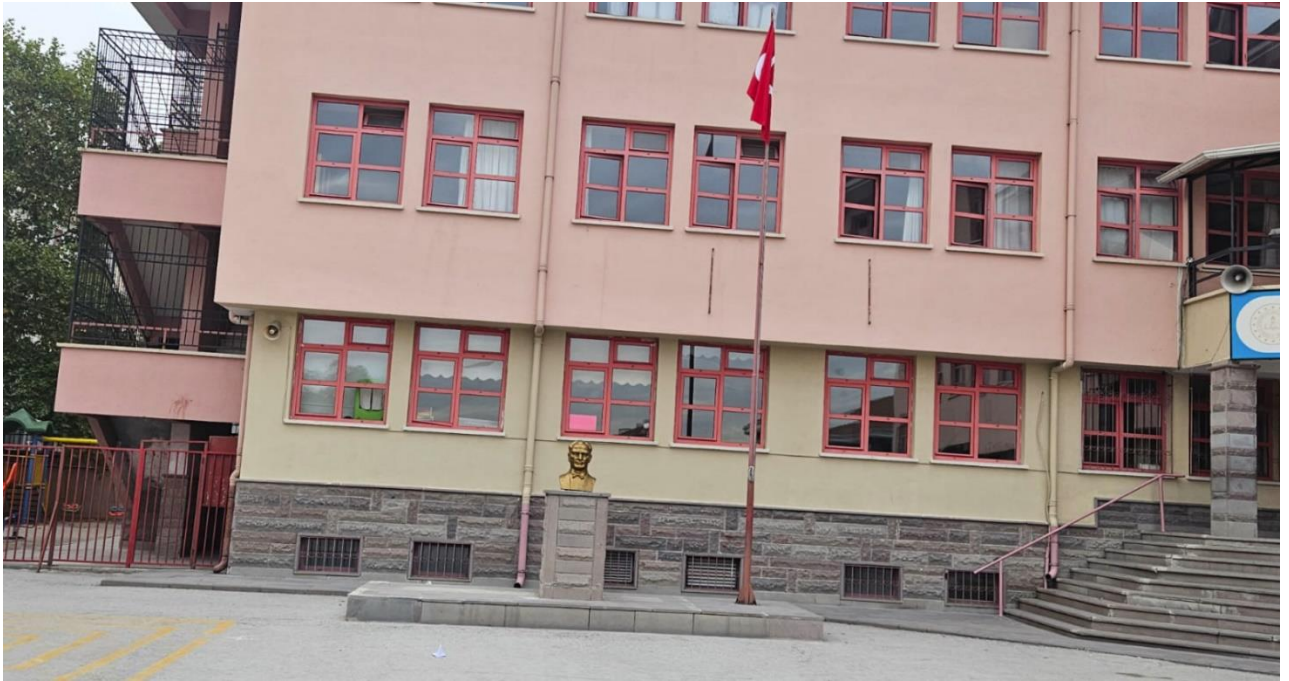
Şekil 4. Emin Sağlamer Ortaokulu Dış Görünüş-2