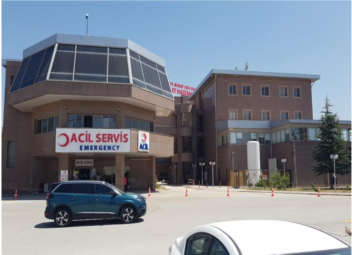
Şekil 4. Beytepe Şehit Murat Erdi Eker Devlet Hastanesi 'nden Bir Görünüm