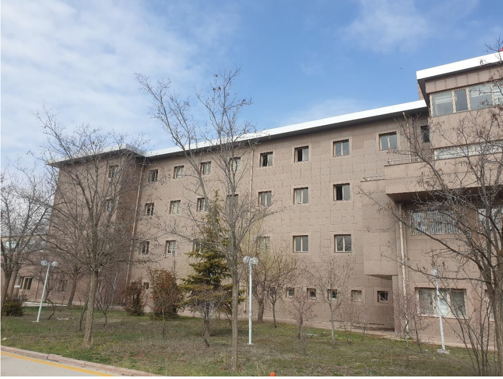
Fotoğraf 1. Beytepe Murat Erdi Eker Devlet Hastanesi Dış Görünüş-1