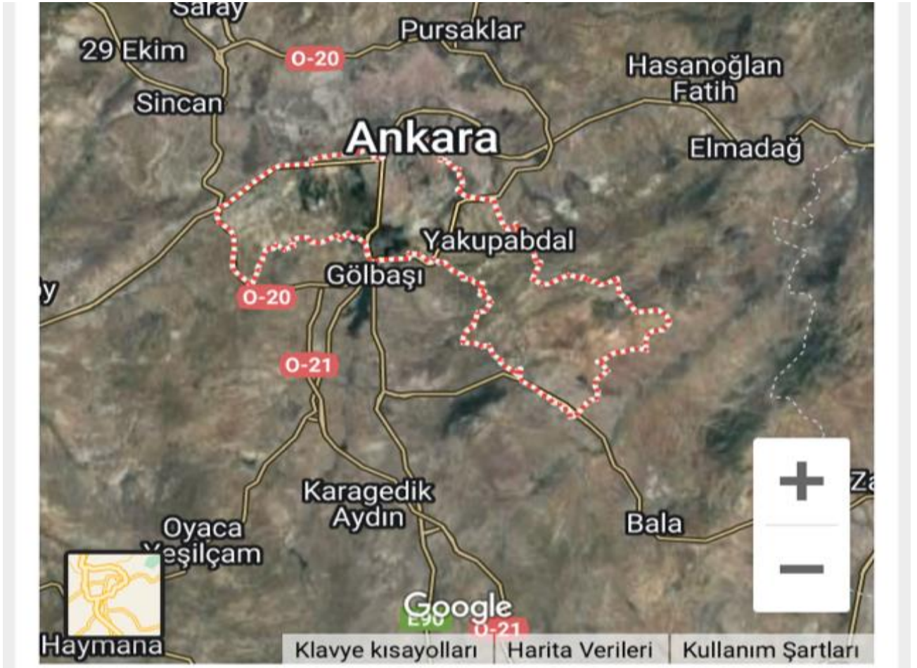
Şekil 1. Çankaya İlçesi Coğrafi Konumu