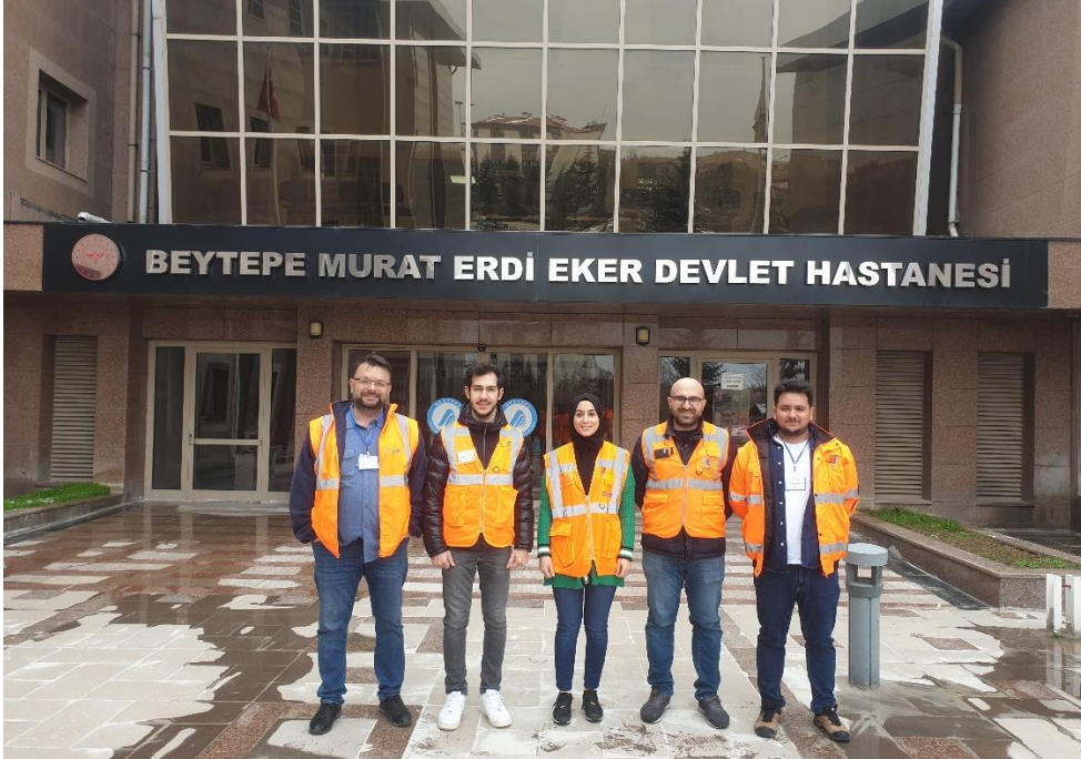
Fotoğraf 2. Beytepe Murat Erdi Eker Devlet Hastanesi Dış Görünüş-2