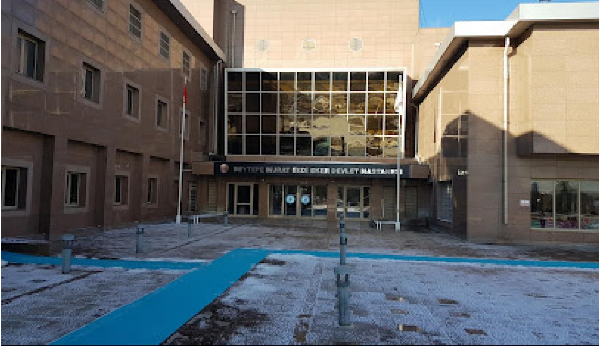
Şekil 3. Beytepe Şehit Murat Erdi Eker Devlet Hastanesi Genel Görünüm