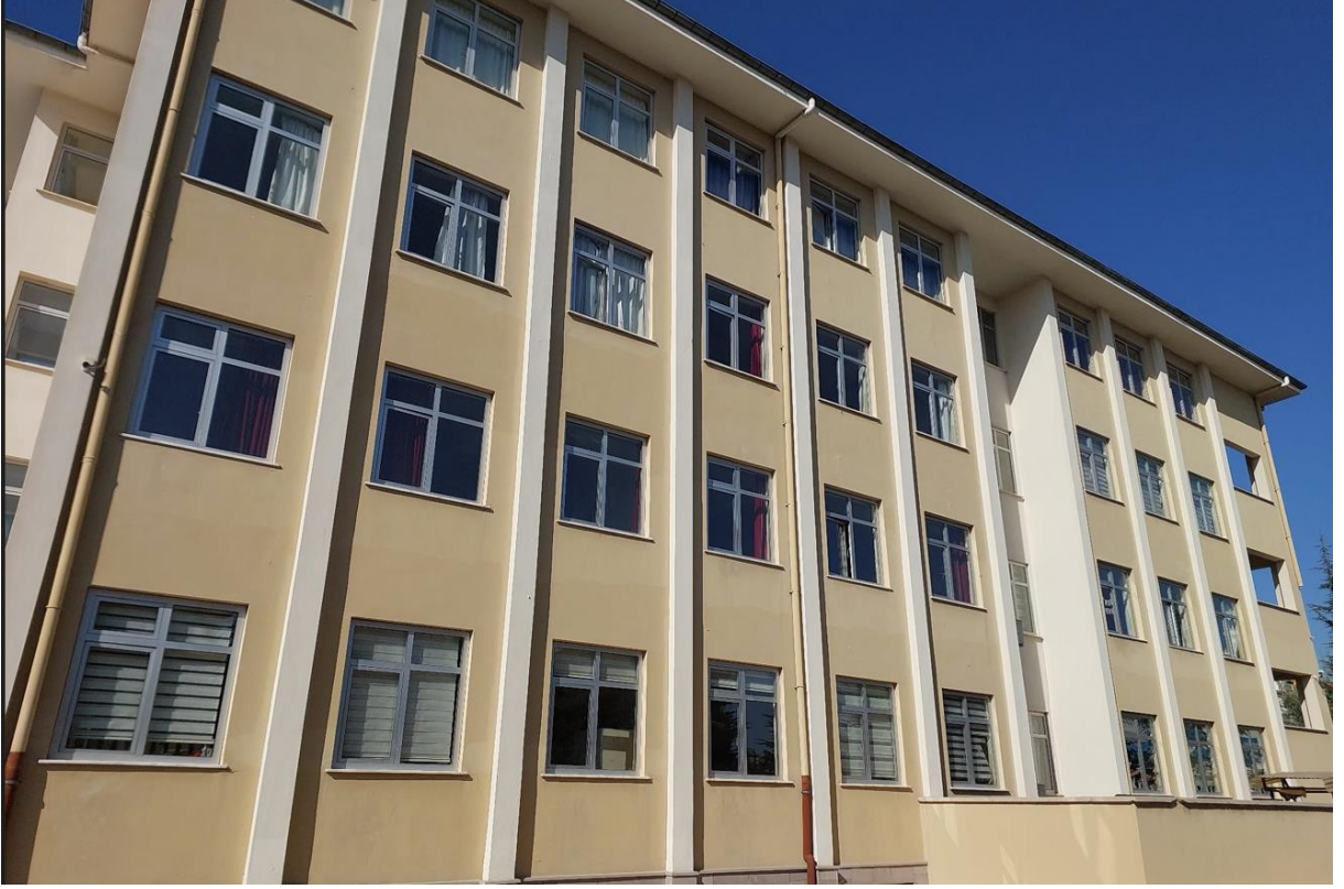
Fotoğraf 1. Beypazarı Evliya Çelebi Mesleki ve Teknik Anadolu Lisesi'nden bir Görünüş