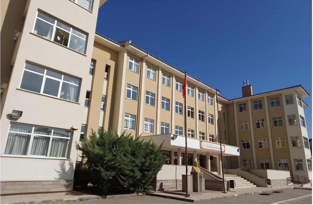
Şekil 3. Beypazarı Evliya Çelebi Mesleki ve Teknik Anadolu Lisesi Dış Görünüş-1