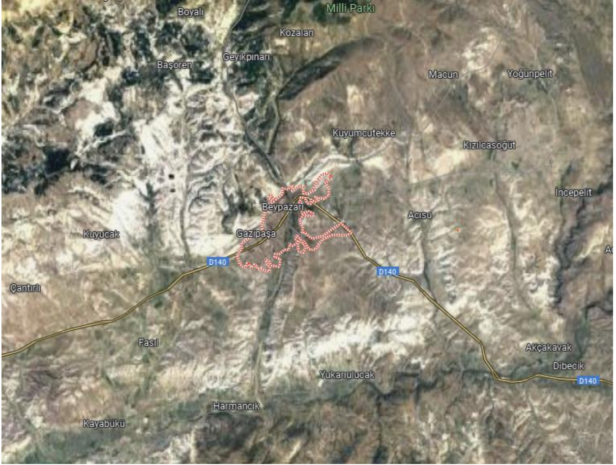
Şekil 1. Beypazarı İlçesi Coğrafi Konumu