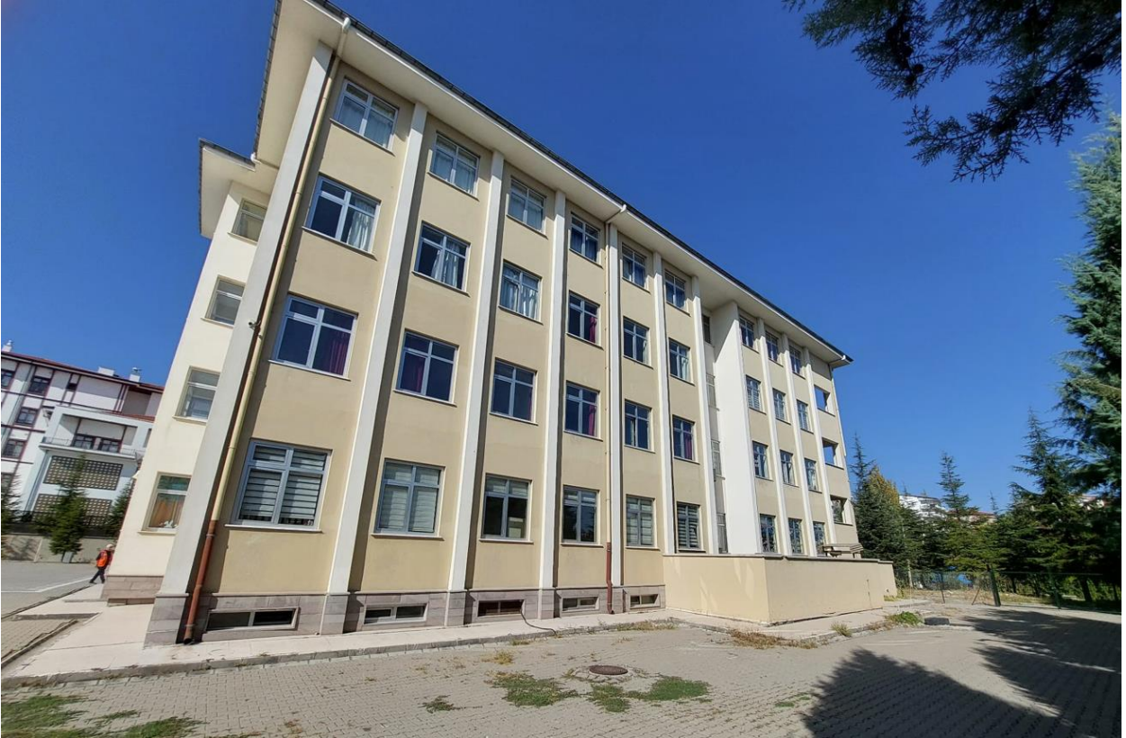
Şekil 4. Beypazarı Evliya Çelebi Mesleki ve Teknik Anadolu Lisesi Dış Görünüş-2