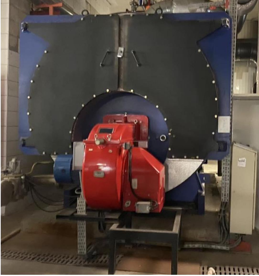
Fotoğraf 7. İstanbul Anadolu Adalet Sarayı Isıtma Kazanları Genel Görünümü