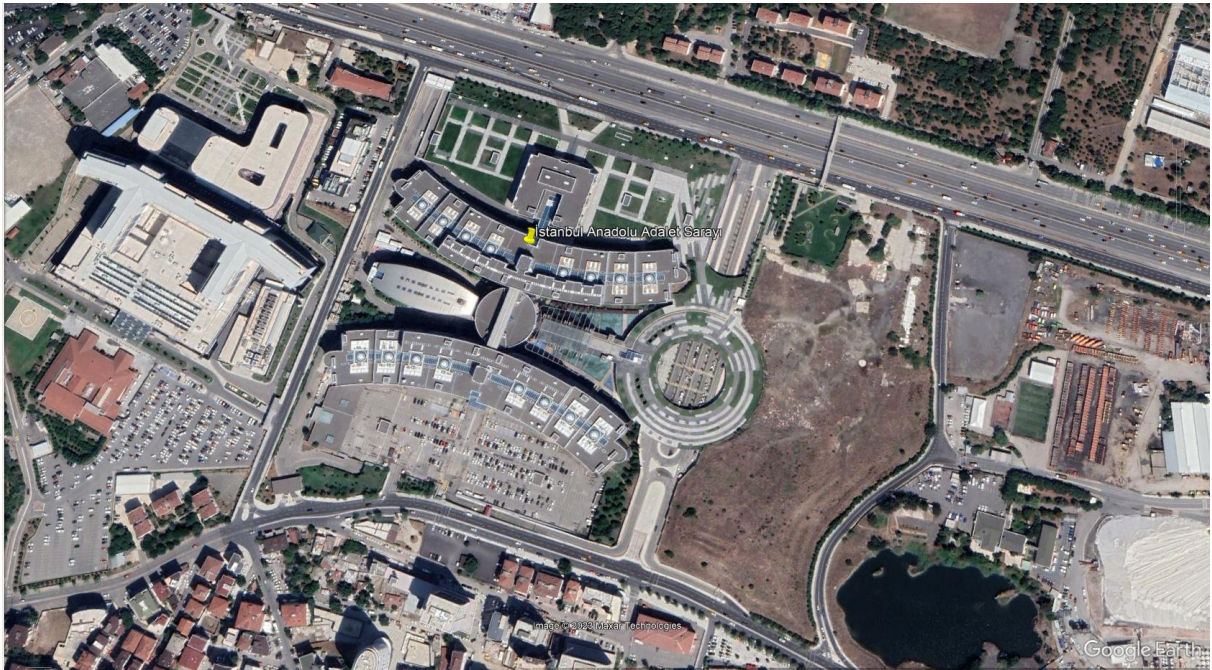
Şekil 2. İstanbul Anadolu Adalet Sarayı Uydu Görüntüsü – 2