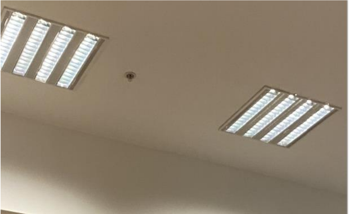
Fotoğraf 9. İstanbul Anadolu Adalet Sarayı Aydınlatma Armatür Örnekleri