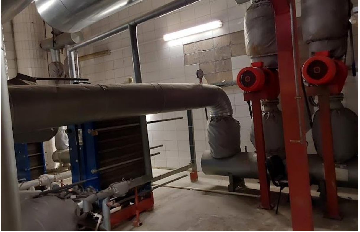
Fotoğraf 8. İstanbul Anadolu Adalet Sarayı Primer Sirkülasyo Pompaları