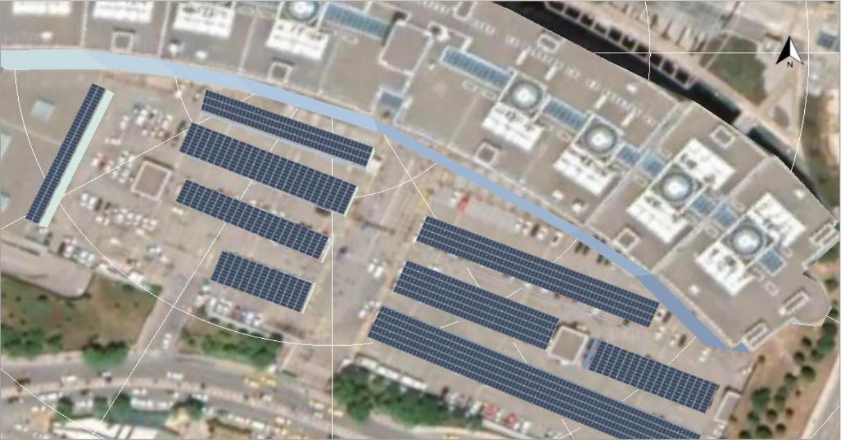
Fotoğraf 11. İstanbul Anadolu Adalet Sarayı Otopark Üstü PV Kurulum Tasarım Görünümü