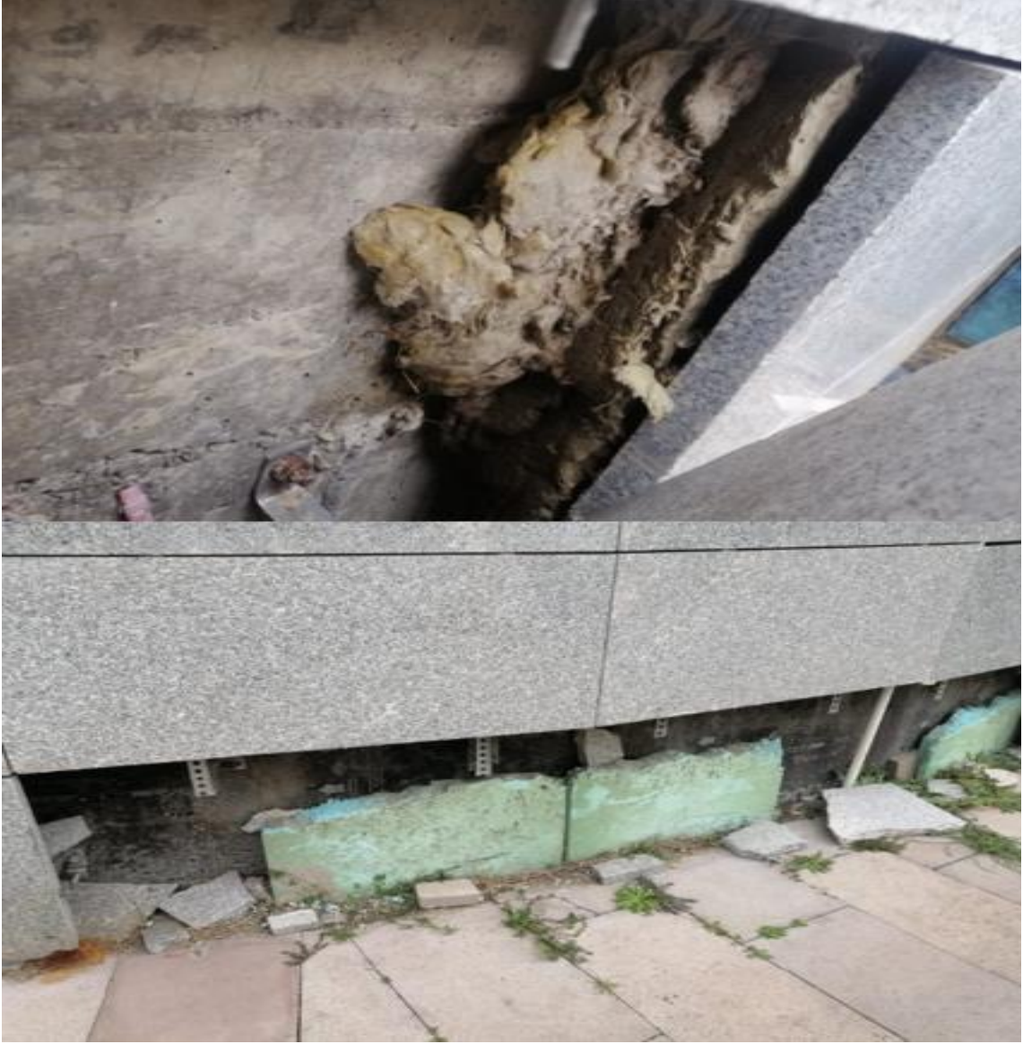
Fotoğraf 6. İstanbul Anadolu Adalet Sarayı Mevcut Yalıtım Görünümü