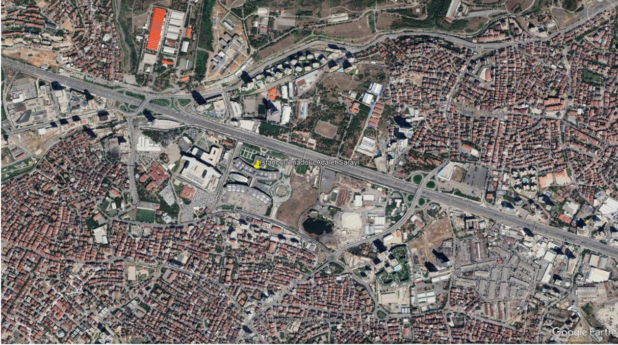
Şekil 1. İstanbul Anadolu Adalet Sarayı Uydu Görüntüsü - 1