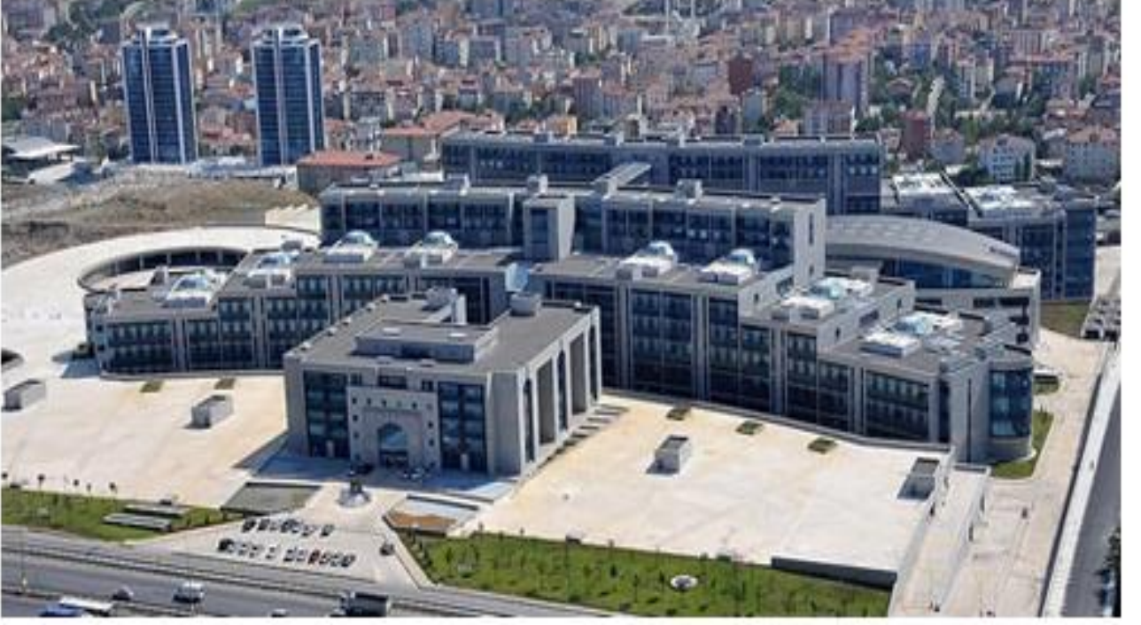
Şekil 3. İstanbul Anadolu Adalet Sarayı Görünümü