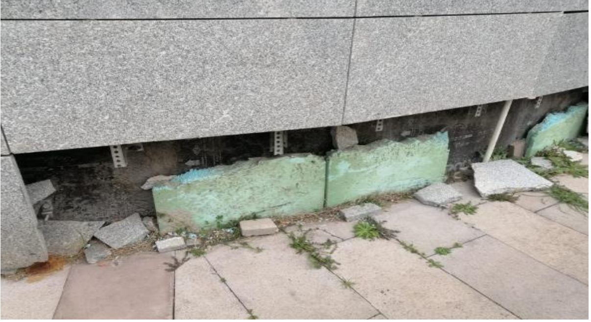
Fotoğraf 3. İstanbul Anadolu Adalet Sarayı Duvar Yapısı Mevcut Yalıtım Görünümü