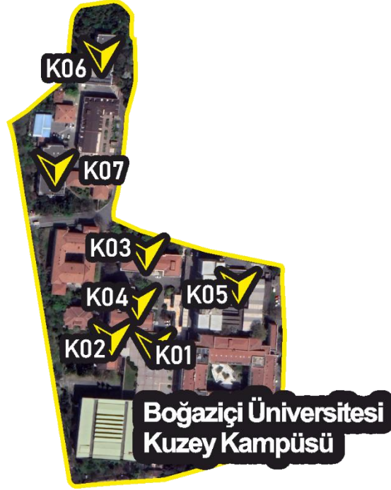
Şekil. 2 Kapsama Giren Binaların Kampüs İçindeki Konumları

Proje kapsamına giren binalar ve kampüs içindeki konumları aşağıda verilmiştir.