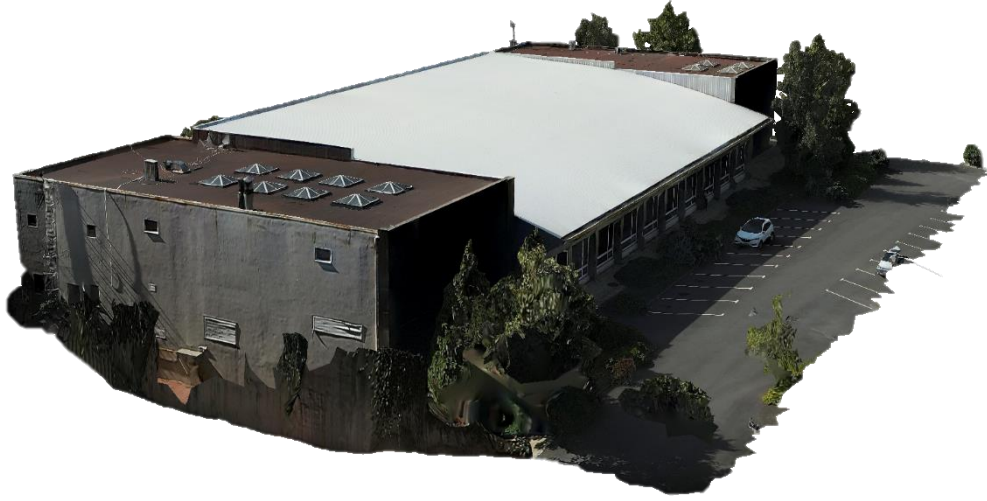
Şekil 4 Hisar Kampüsü Kapalı Spor Salonu ve Yüzme Havuzu katı model görüntüsü