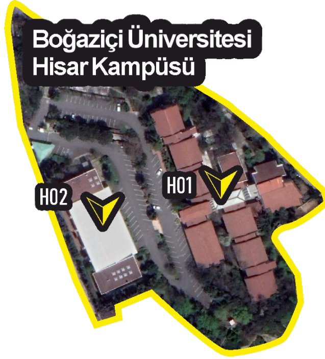
Şekil. 2 Kapsama Giren Binaların Kampüs İçindeki Konumları

Proje kapsamına giren binalar ve kampüs içindeki konumları aşağıda verilmiştir.