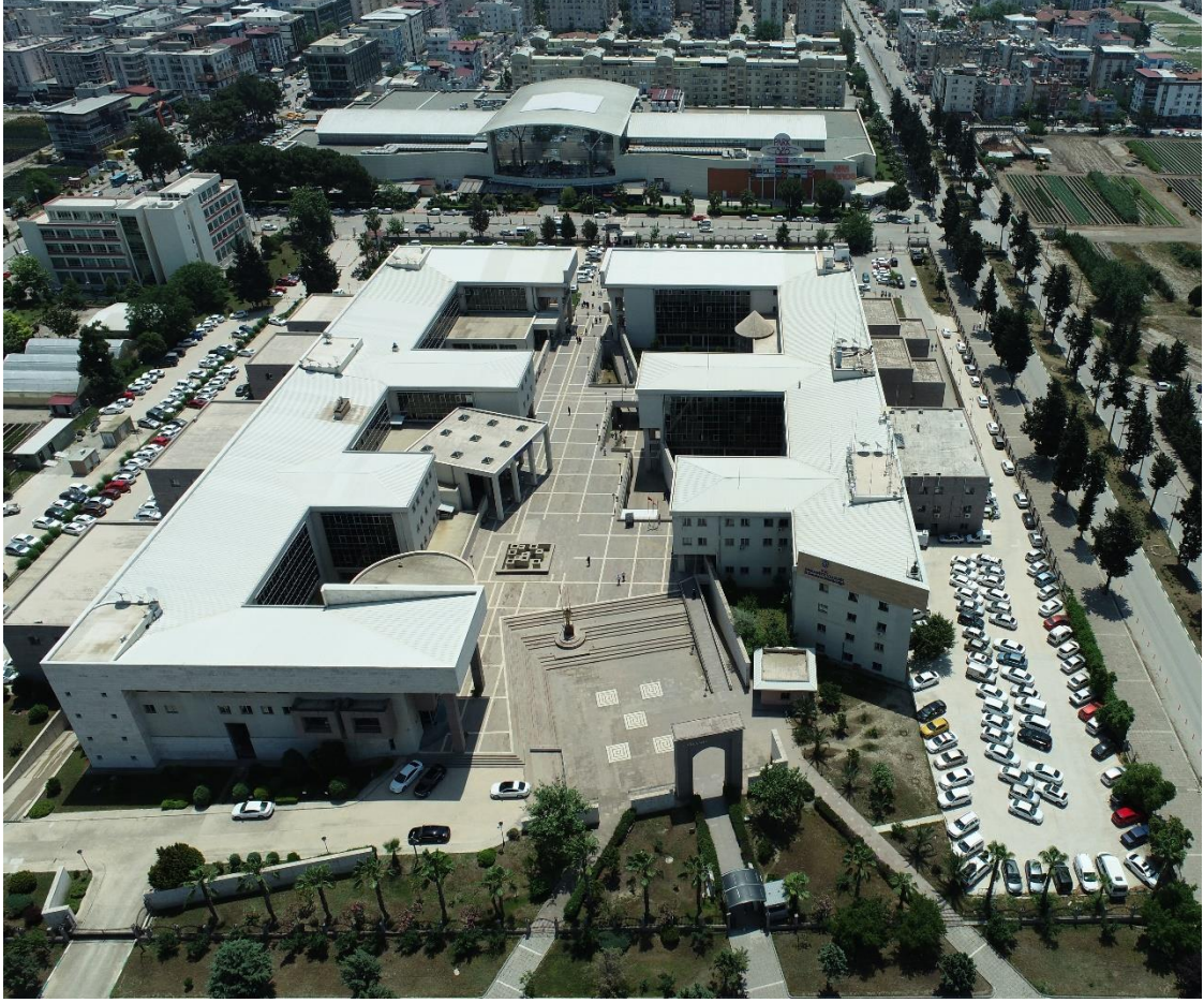
Şekil 4. Osmaniye Valilik Binası Genel Görünümü