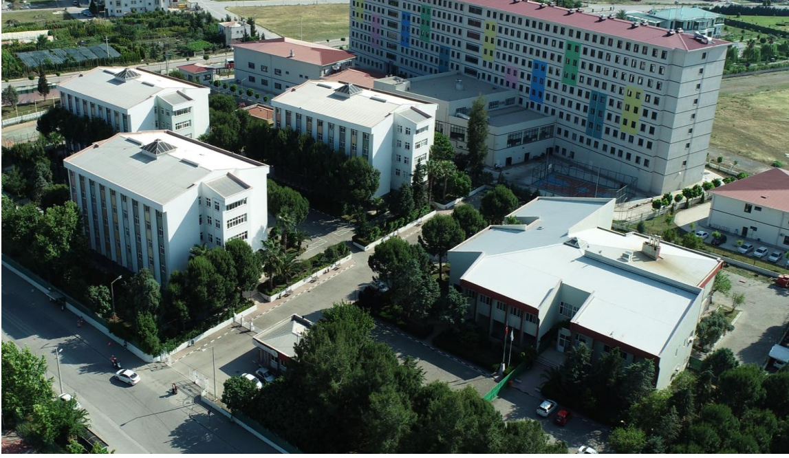
Şekil 4. KYK Osmaniye Kız Öğrenci Yurdu Genel Görünümü