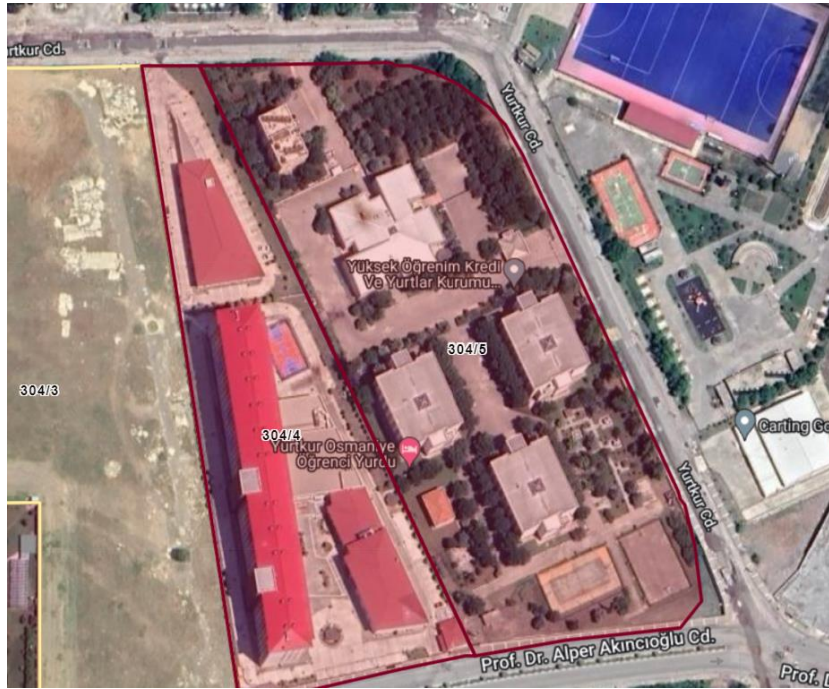
Şekil 3. KYK Osmaniye Kız Öğrenci Yurdu Uydu Görüntüsü-2