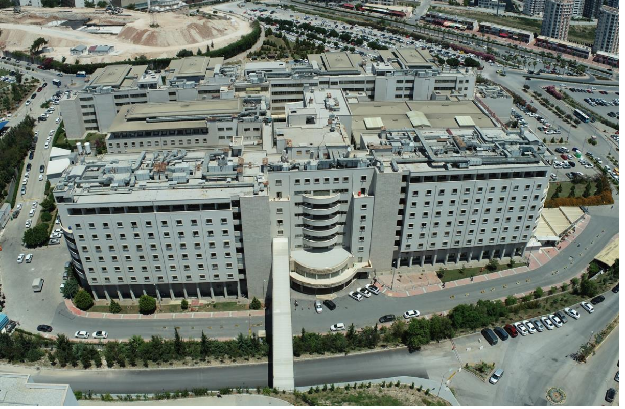
Fotoğraf 1. MEÜ Tıp Fakültesi Eğitim ve Araştırma Hastanesi Binası Dış Görünüş