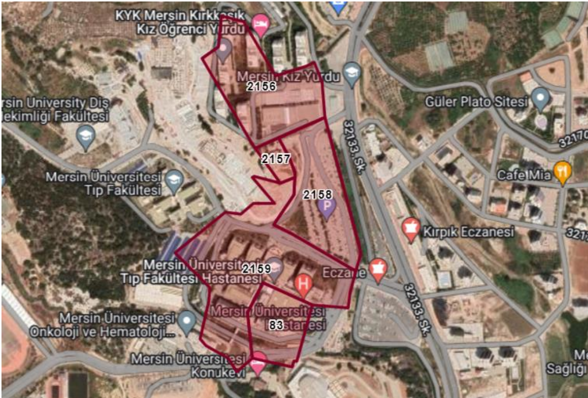
Şekil 3. MEÜ Tıp Fakültesi Eğitim Araştırma Hastanesi Uydu Görüntüsü-2