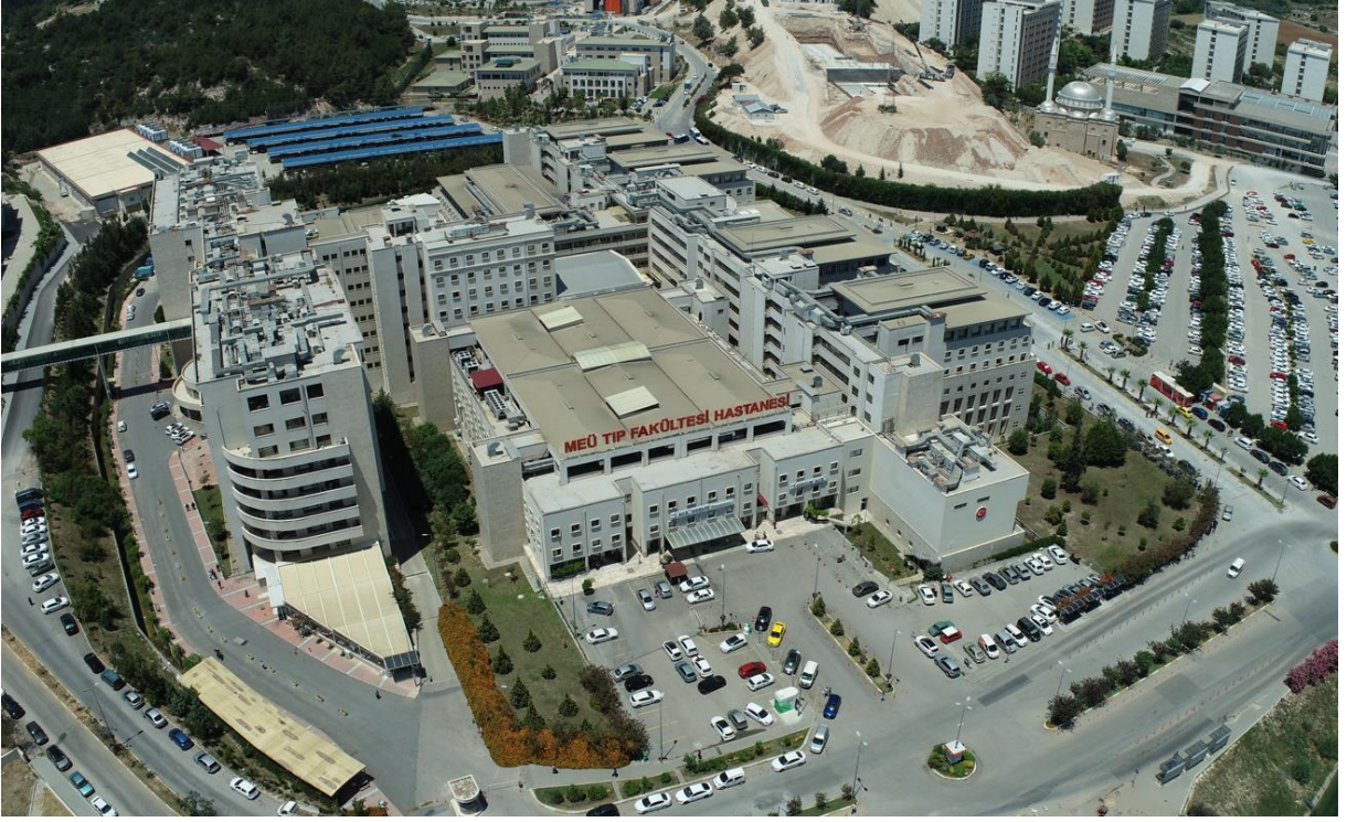
Şekil 4. MEÜ Tıp Fakültesi Eğitim ve Araştırma Hastanesi Genel Görünümü