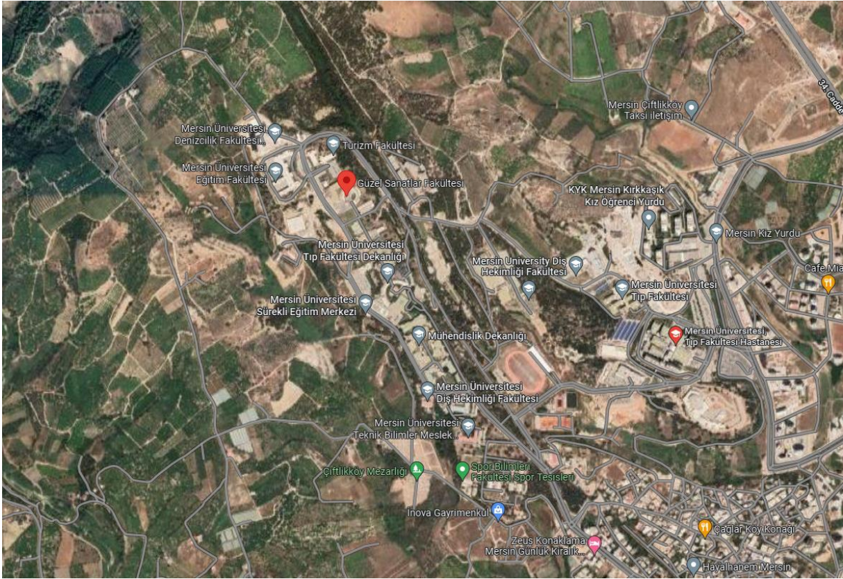
Şekil 1. MEÜ Mimarlık ve Güzel Sanatlar Fakültesi Binası Coğrafi Konumu

Mersin Üniversitesi Mimarlık ve Güzel Sanatlar Fakültesi 36^{\circ}47'25''N 34^{\circ}31'24''E koordinatlarındadır. Günün hemen her saati şehir merkezinden ve çeşitli semtlerden üniversiteye toplu ulaşım mevcuttur. Adana-Erdemli otoyolundan veya Mersin-Silifke yolundan yaklaşık 5 km mesafede üniversite sahasına ulaşılabilir.