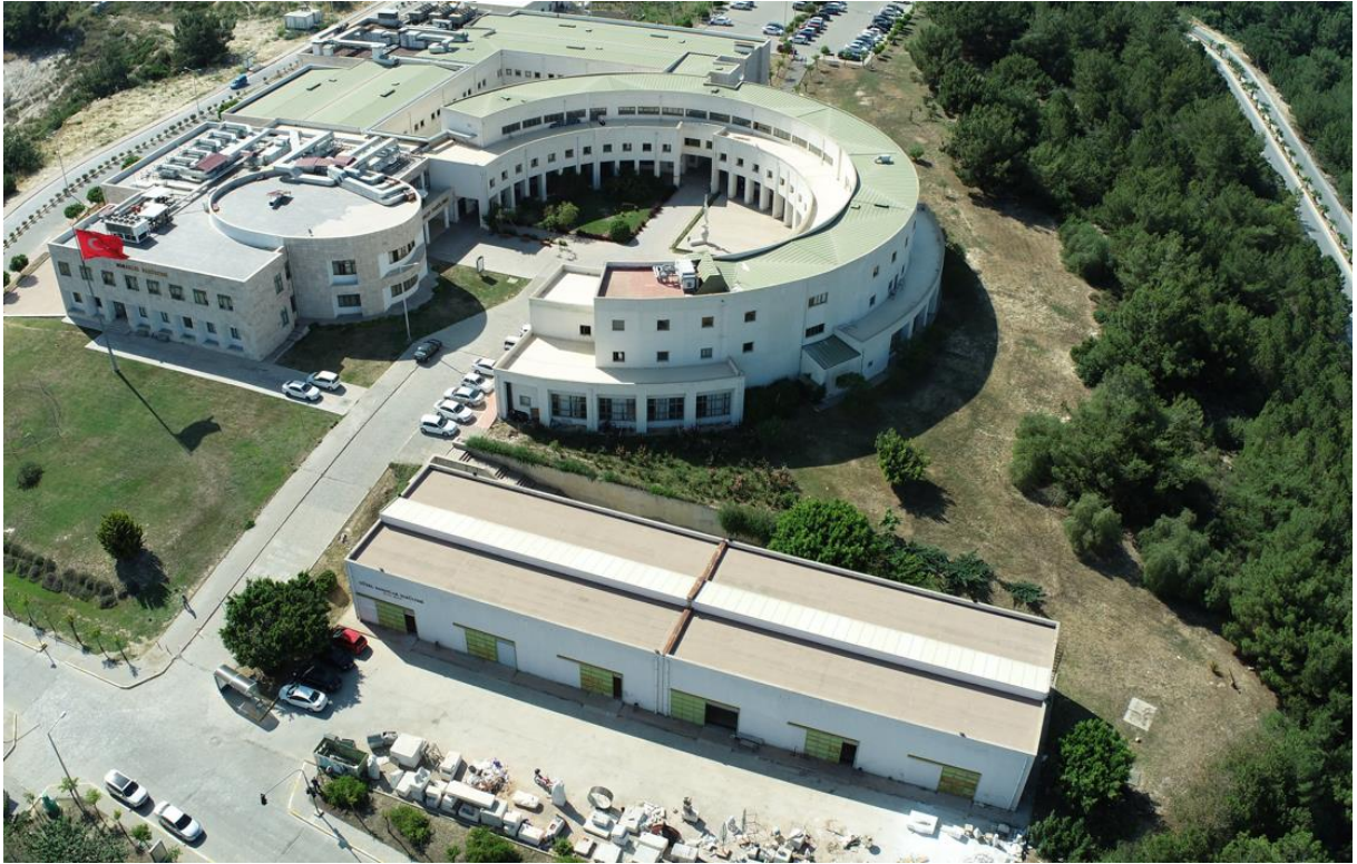
Şekil 4. MEÜ Mimarlık ve Güzel Sanatlar Fakültesi Genel Görünümü