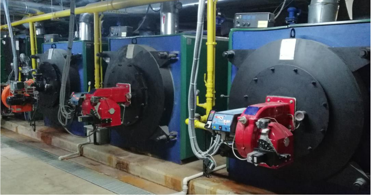
Fotoğraf 7. Samsun Eğitim ve Araştırma Hastanesi Isı Merkezi Kazan Görünümü