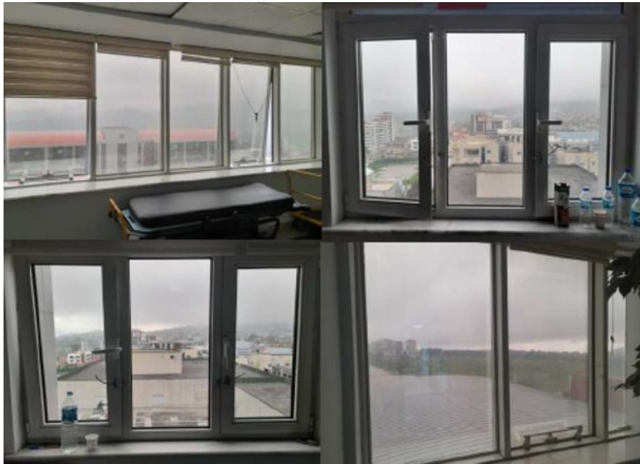
Fotoğraf 4. Samsun Eğitim ve Araştırma Hastanesi Binası Pencere Örneği