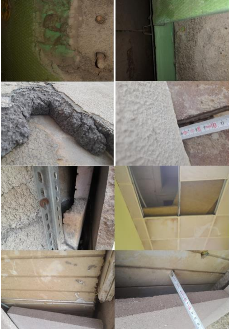
Fotoğraf 6. Samsun Eğitim ve Araştırma Hastanesi Mevcut Yalıtım Görünümü