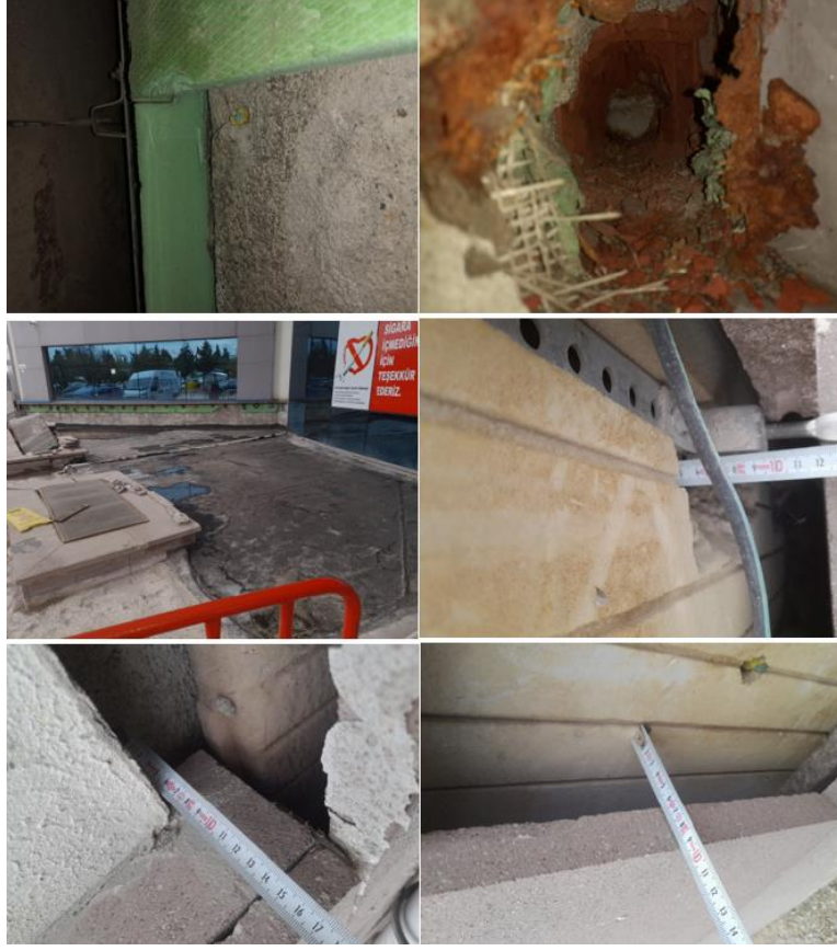
Fotoğraf 3. Samsun Eğitim ve Araştırma Hastanesi Bina Yalıtım Görünüm Örnekleri