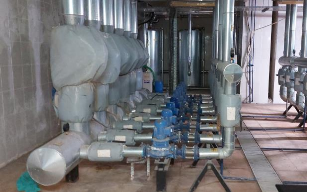
Fotoğraf 8. Samsun Eğitim ve Araştırma Hastanesi Kazan Dairesi FCU Pompa Grupları