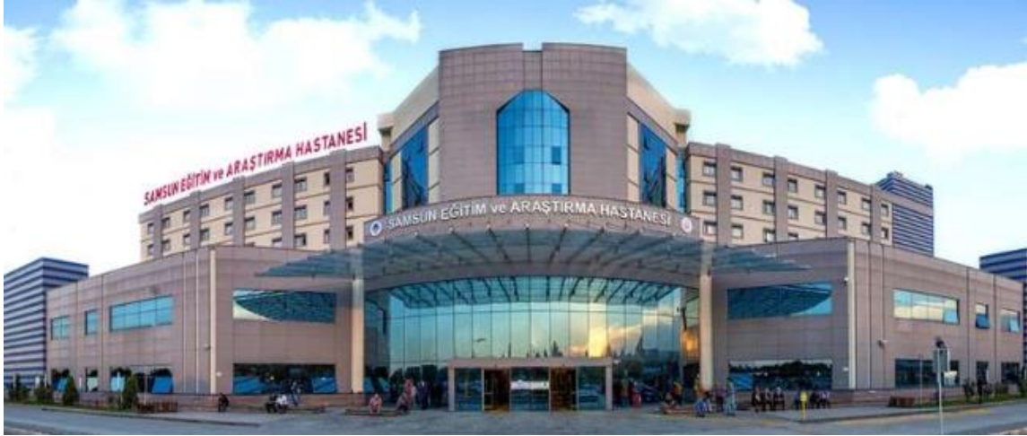
Şekil 3. Samsun Eğitim ve Araştırma Hastanesi Görünümü