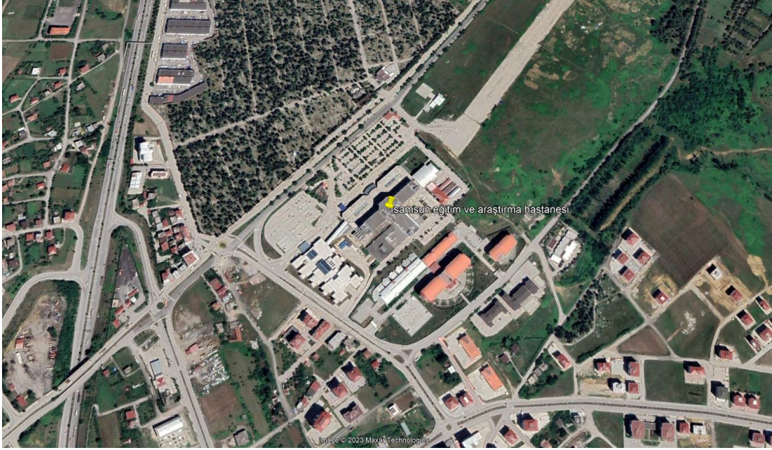
Şekil 2. Samsun Eğitim ve Araştırma Hastanesi Uydü Görüntüsü – 2