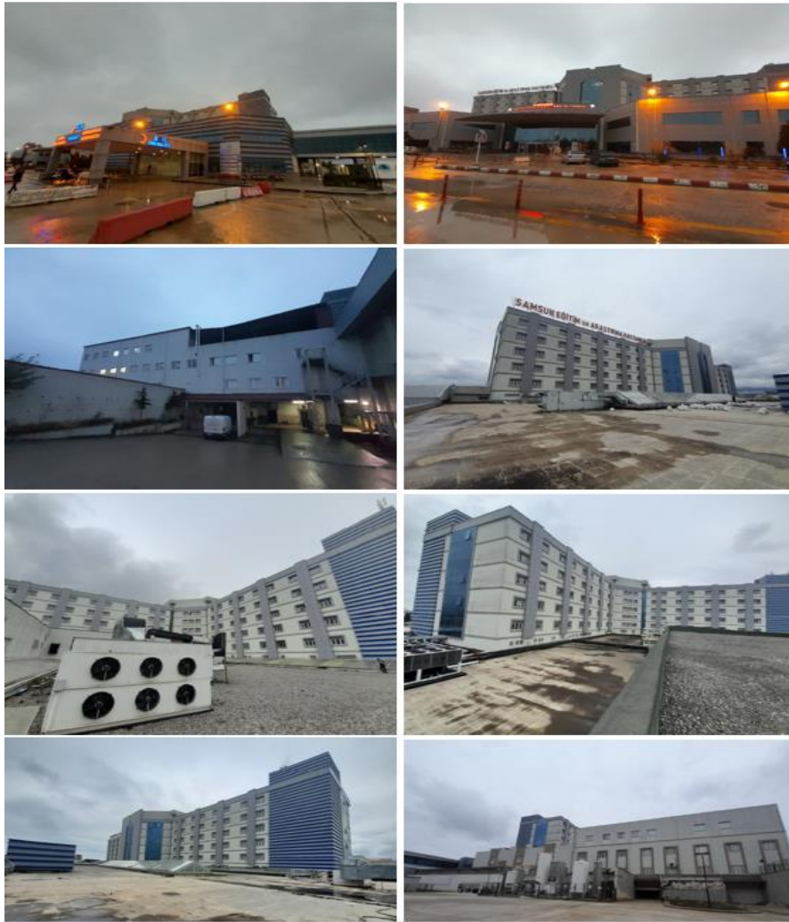
Fotoğraf 2. Samsun Eğitim ve Araştırma Hastanesi Dışarıdan Görünümü