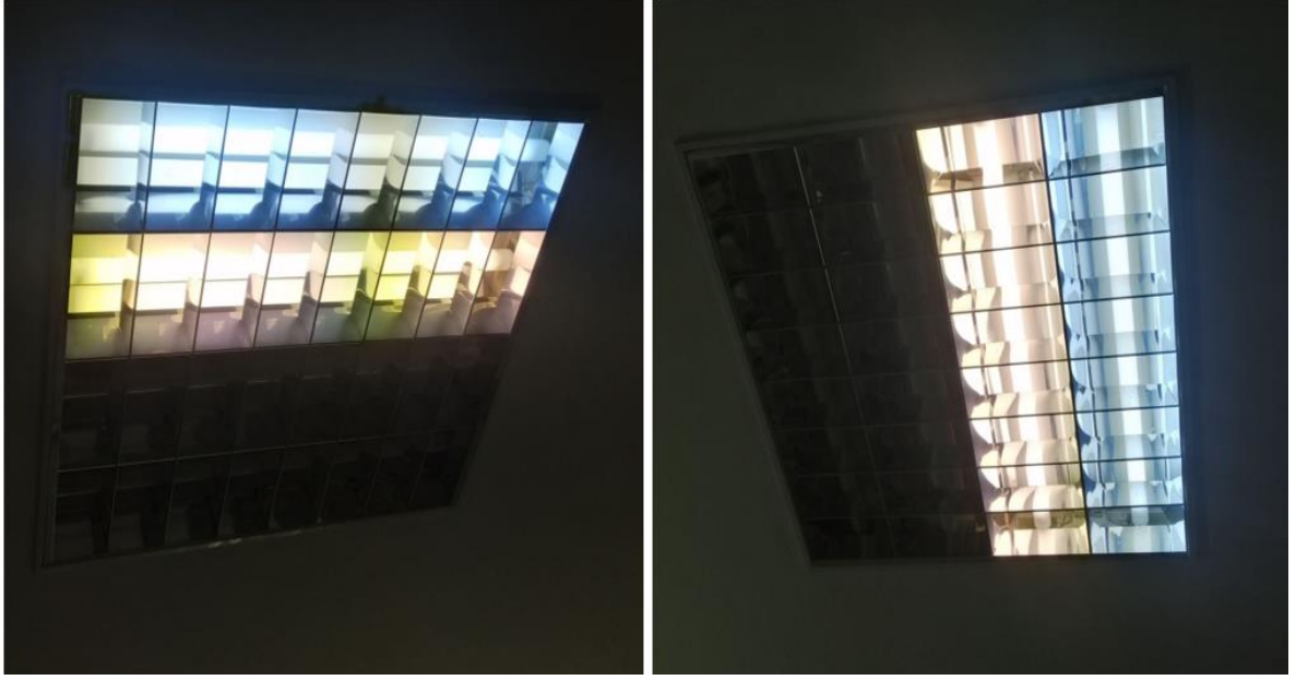
Fotoğraf 9. Samsun Eğitim ve Araştırma Hastanesi Aydınlatma Armatür Örnekleri