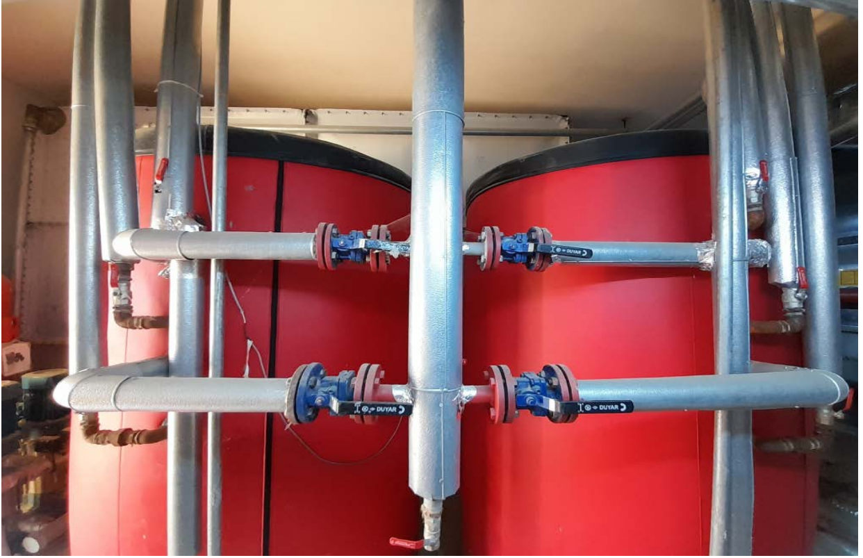
Fotoğraf 14. Atakum Anadolu İmam Hatip Lisesi Erkek Okul Sıcak Kullanım Suyu Boyleri (2500 lt)