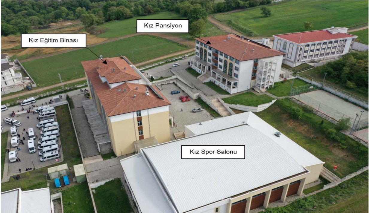
Şekil 5. Atakum Anadolu İmam Hatip Lisesi Kız Eğitim Binası, Kız Spor Salonu, Kız Pansiyon Görünümü