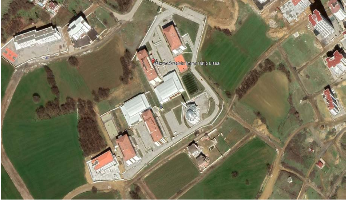
Şekil 2. Atakum Anadolu İmam Hatip Lisesi Uydu Görüntüsü – 2