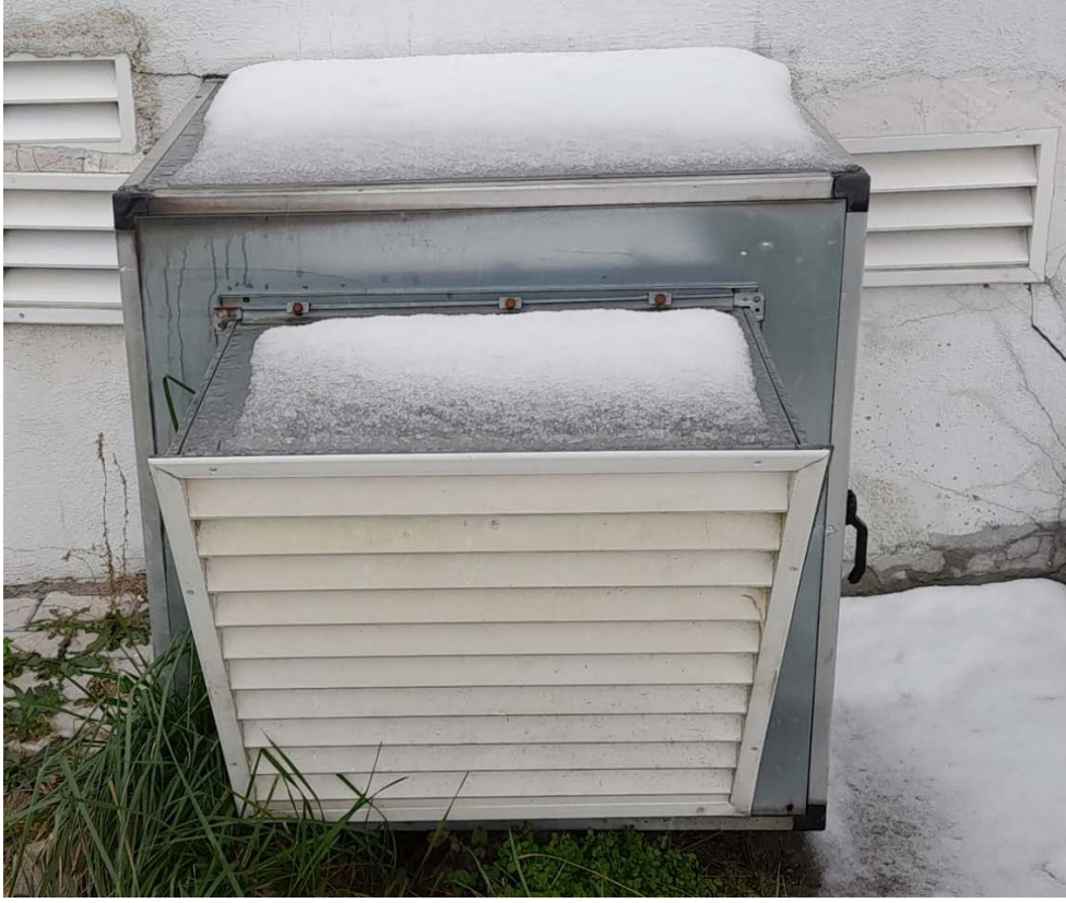
Fotoğraf 16. Atakum Anadolu İmam Hatip Lisesi Erkek Pansiyon Hücreli Aspiratör Sistemine ait Görüntü