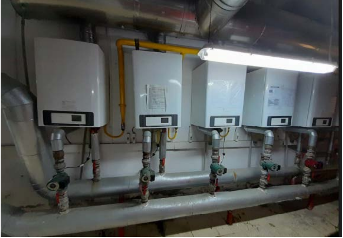
Fotoğraf 10. Atakum Anadolu İmam Hatip Lisesi Erkek Okul Isı Merkezi Kazan Görünümü