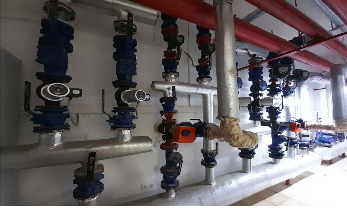
Fotoğraf 12. Atakum Anadolu İmam Hatip Lisesi Erkek Okul ve Spor Salonu Isıtma Sistemi Pompaları Görünümü ve Gidiş – Dönüş Kolektörü