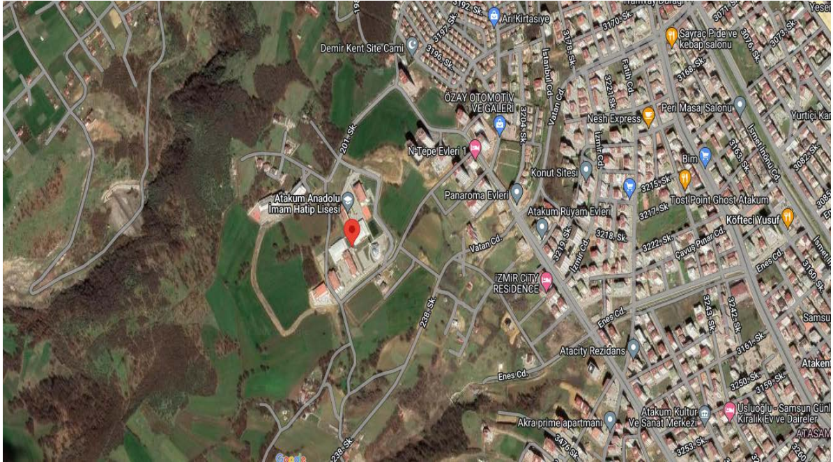
Şekil 1. Atakum Anadolu İmam Hatip Lisesi Uydu Görüntüsü - 1

Gerek yağış gerekse sıcaklık yönünden sürekli farklılıklar görülmekle beraber genellikle yazları yağışlı ve sıcak, kışları yağışlı ve ılık geçer. Yağmur daha çok ilkbahar aylarında düşer.