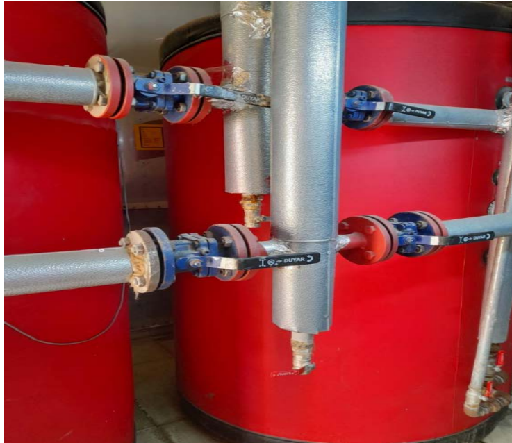
Fotoğraf 15. Atakum Anadolu İmam Hatip Lisesi Kız Okul Sıcak Kullanım Suyu Boyleri (2500 lt)