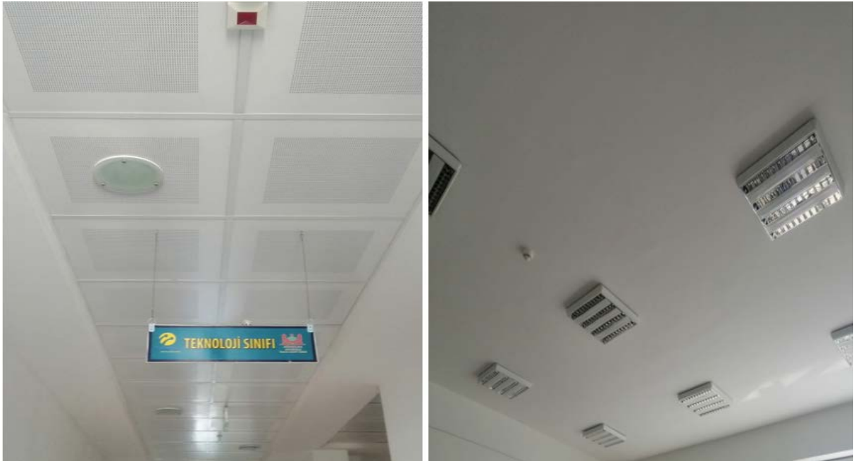
Fotoğraf 17. Atakum Anadolu İmam Hatip Lisesi Koridor ve Sınıf Aydınlatma Armatür Örnekleri