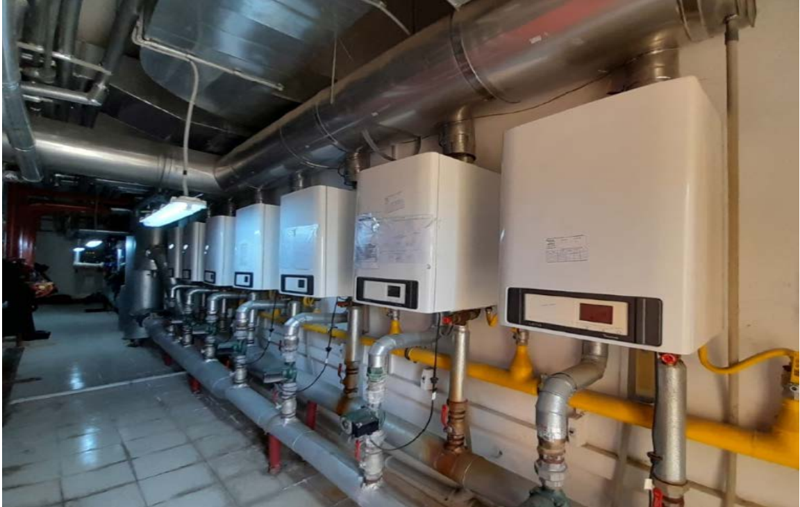
Fotoğraf 11. Atakum Anadolu İmam Hatip Lisesi Kız Okul Isı Merkezi Kazan Görünümü