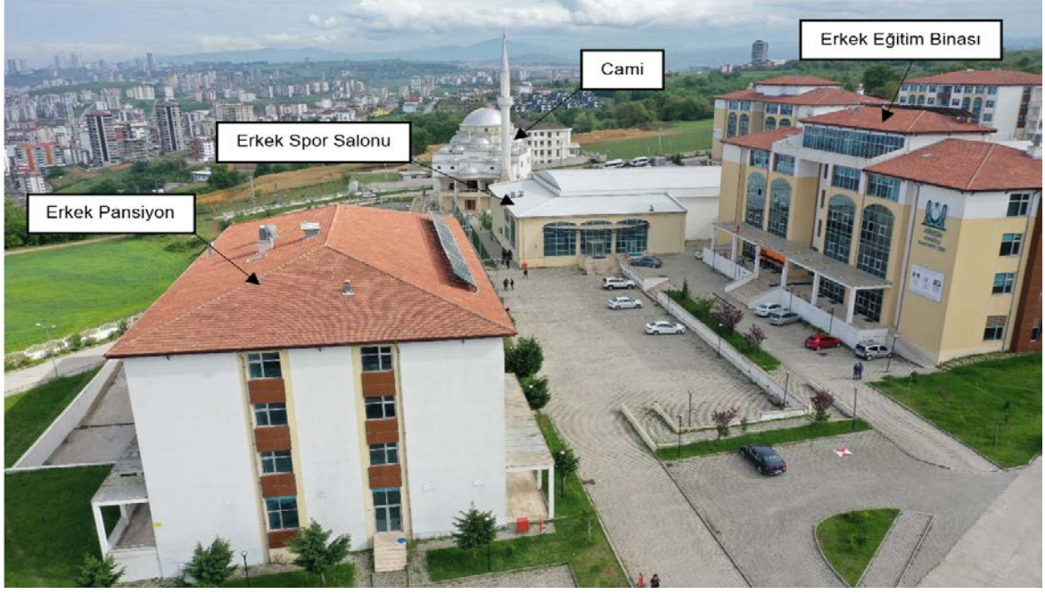
Şekil 4. Atakum Anadolu İmam Hatip Lisesi Erkek Eğitim Binası, Erkek Spor Salonu, Erkek Pansiyon, Cami Görünümü