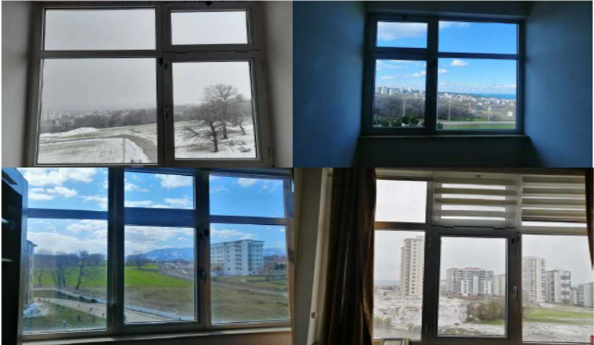
Fotoğraf 9. Atakum Anadolu İmam Hatip Lisesi Erkek Pansiyon Binası Pencere Örneği