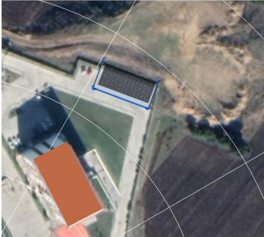
Fotoğraf 19. Atakum Anadolu İmam Hatip Lisesi Açık Otopark Alanı PV Kurulum Tasarım Görünümü