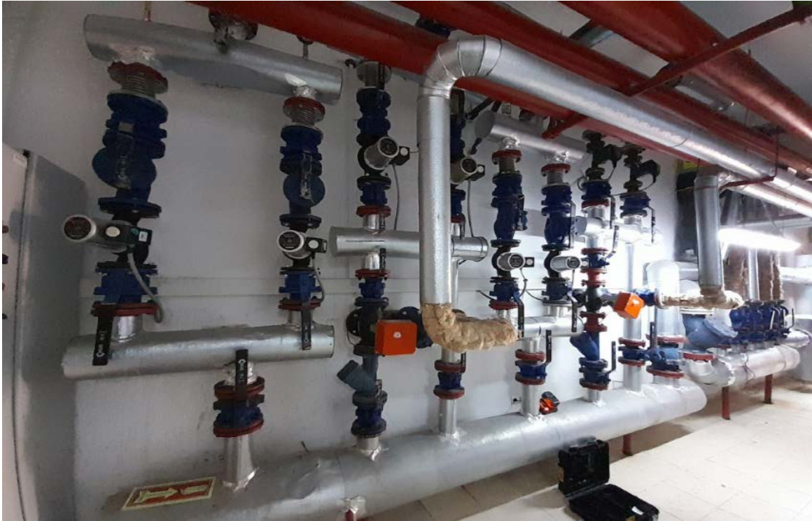
Fotoğraf 13. Atakum Anadolu İmam Hatip Lisesi Kız Okul ve Spor Salonu Isıtma Sistemi Pompaları Görünümü ve Gidiş – Dönüş Kolektörü