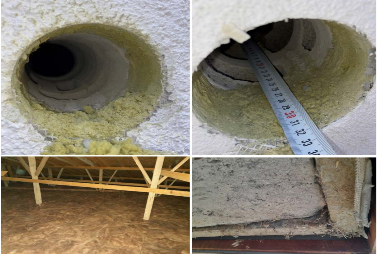
Fotoğraf 8. Atakum Anadolu İmam Hatip Lisesi Okul ve Pansiyon Binaları Yalıtım Görünüm Örnekleri