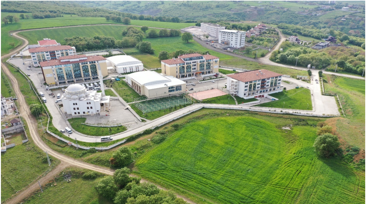
Şekil 3. Atakum Anadolu İmam Hatip Lisesi Genel Görüntü